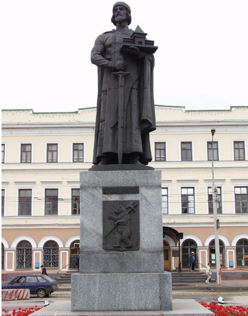
Памятник Ярославу Мудрому в Ярославле