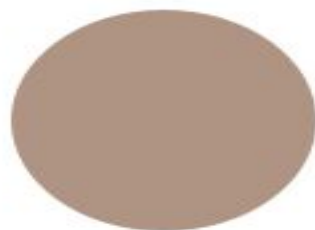
Бежево-серый Warm Taupe