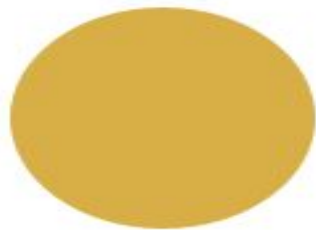
Желтый Spicy Mustard