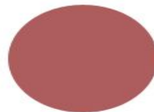
Кирпично-красный Dusty Cedar