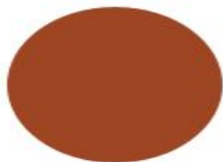
Коричнево-рыжий Potter's Clay