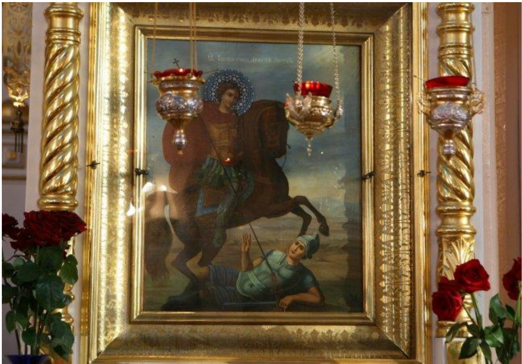
Икона св. великомученика Димитрия Солунского.