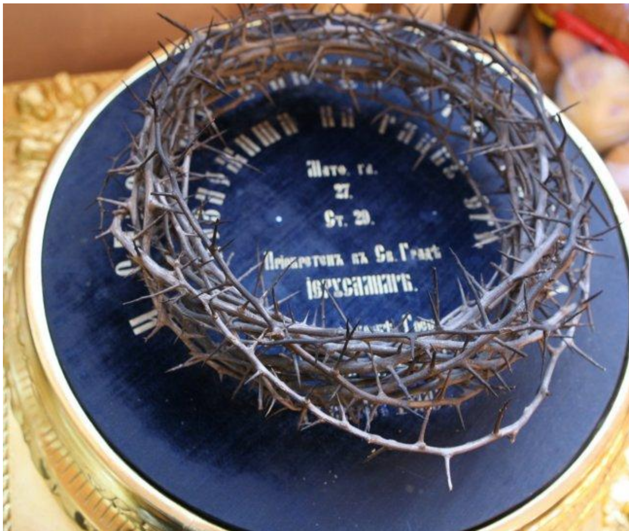
Старинная паломническая «святынька» – копия Тернового венца Христова