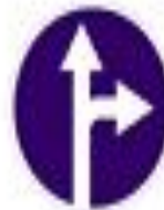
4.1.4 Движение прямо или направо