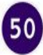
4.6 Ограничение максимальной скорости