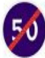
4.7 Конец ограничения максимальной скорости