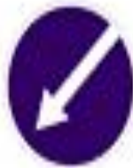
4.2.2 Объезд препятствия слева