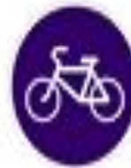
4.4 Велосипедная дорожка