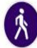
4.5 Пешеходная дорожка