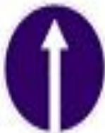
4.1.1 Движение прямо