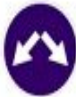
4.2.3 Объезд препятствия справа или слева