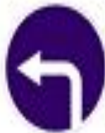
4.1.3 Движение налево