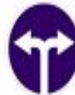
4.1.6 Движение направо или налево