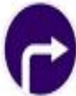
4.1.2 Движение направо