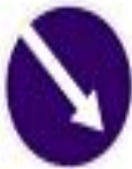
4.2.1 Объезд препятствия справа