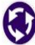
4.3 Круговое движение