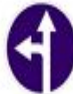
4.1.5 Движение прямо или налево