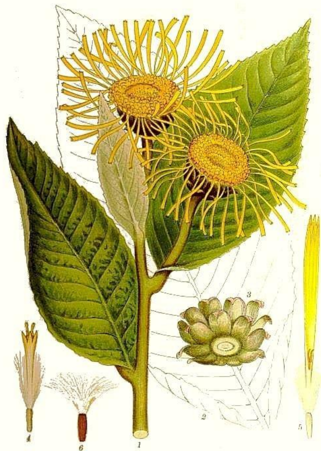
ALANT, INULA HELENIUM L.

Девясил высокий — крупное растение высотой 60-180 см. Корневище толстое, короткое, многоглавое, корни до 20 см длиной и 2-3 см толщиной. Листья продолговато-эллиптические, неравнозубчатые, снизу густоопушённые, бархатистые. Цветки жёлтые, краевые — ложноязычковые и срединные — трубчатые, собраны в крупные корзинки 6-7 см в диаметре. Плод — четырёхгранная бурая семянка с хохолком,. Цветет в июле — августе, плоды созревают в августе — сентябре.