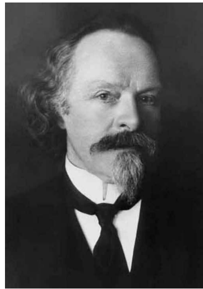
К. Д. Бальмонт