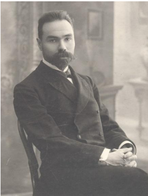
В. Я. Брюсов