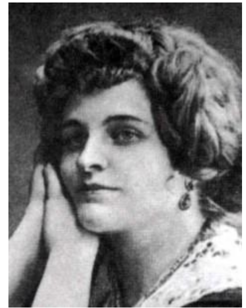
З. Н. Гиппиус