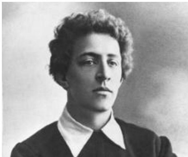
А. А. Блок