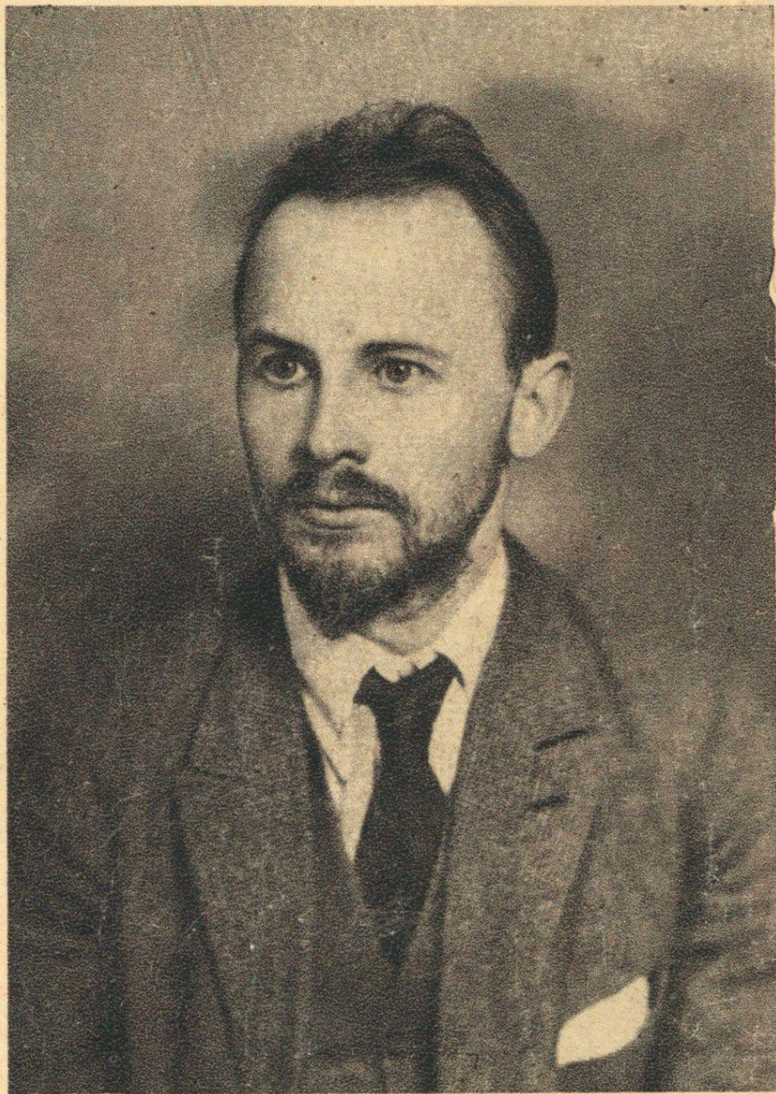
Н. И. Бухарин.