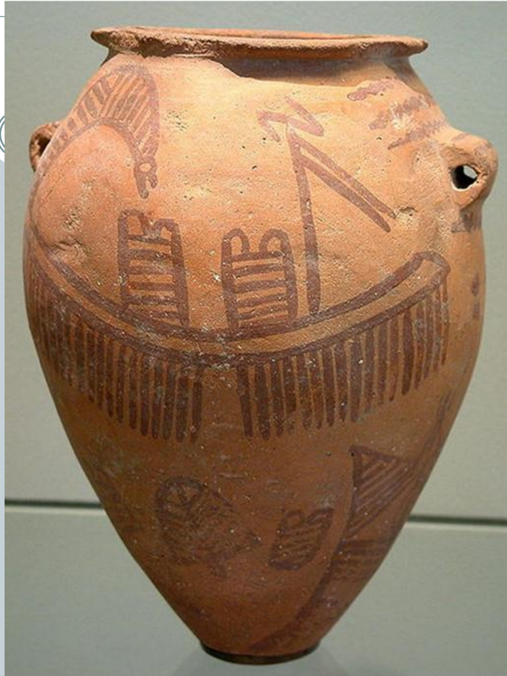
Керамическая ваза, Египет, 3500 до н.э.