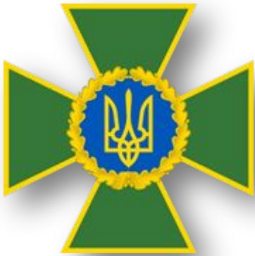
Емблема Державної прикордонної служби України