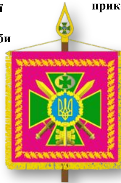
Штандарт Голови Державної прикордонної служби України