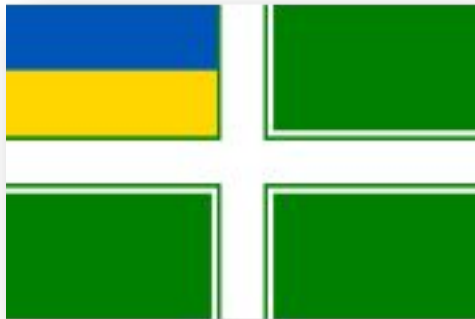
Прапор Морської охорони Державної прикордонної служби України