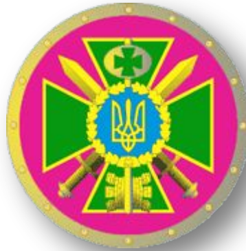
Герб Адміністрації Державної прикордонної служби України