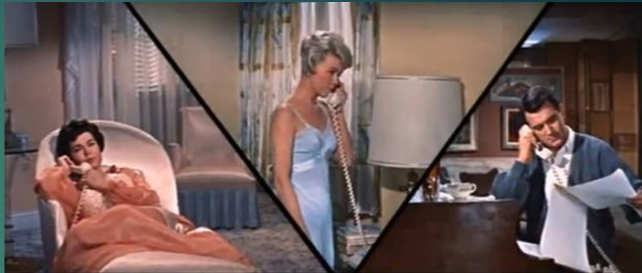
Кадр из фильма «Телефон пополам» (1959)