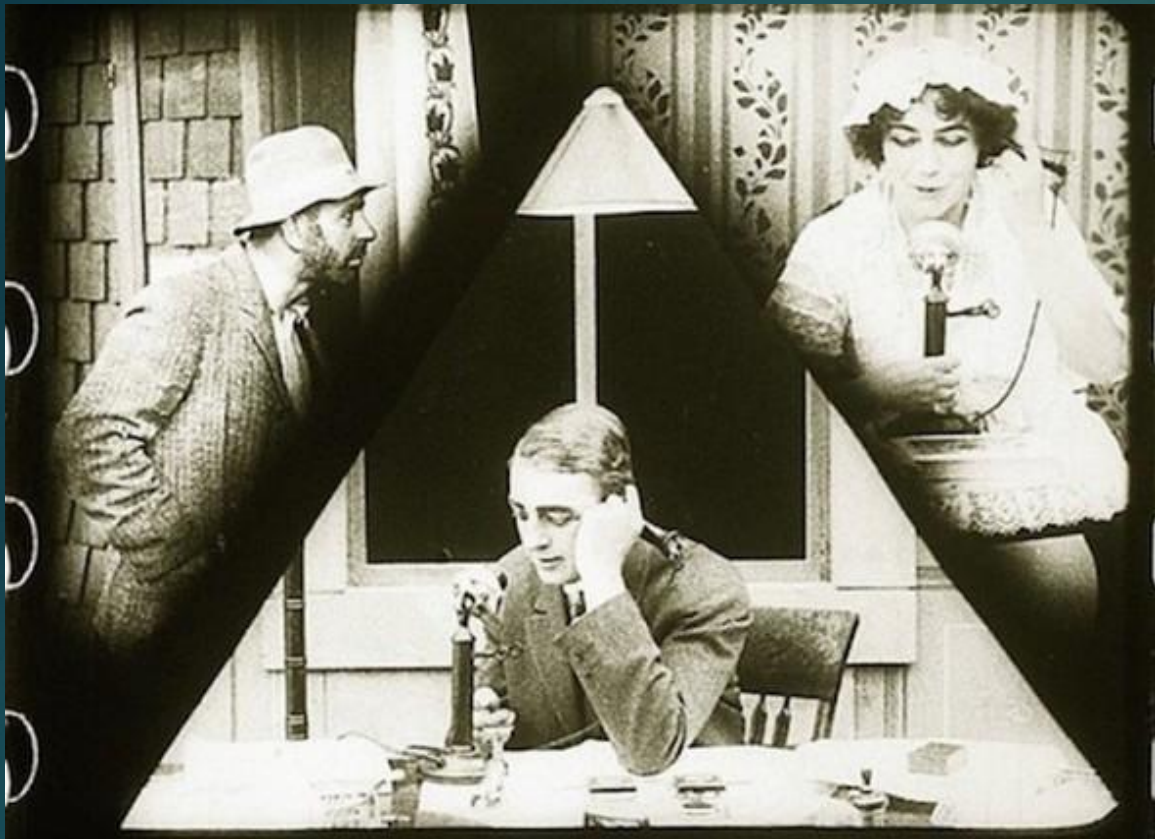
Кадр из фильма «Саспенс» (1913)