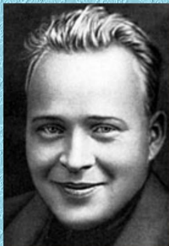
Аркадий Петрович Гайдар

Изучи биографию писателя. Можно ли сказать, что А. Гайдар был лидером. Докажи или опровергни.