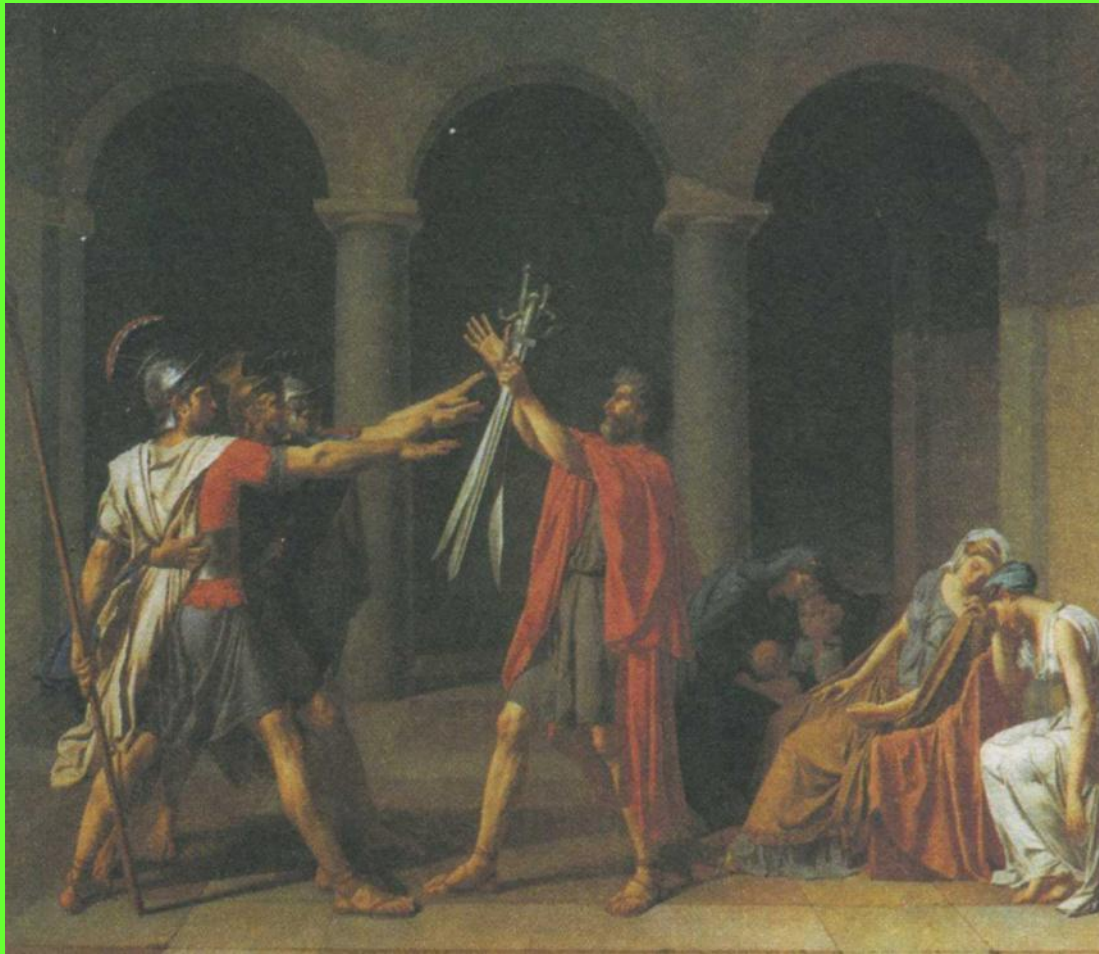
Жак-Луи Давид. Клятва Горациев. 1784 г.