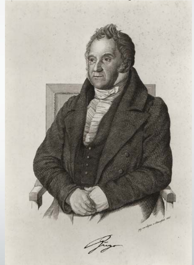
Густав фон Гуго (1764-1844)