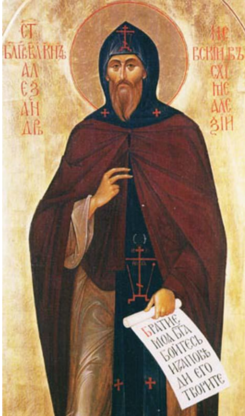
Святой благоверный князь Александр Невский. Икона