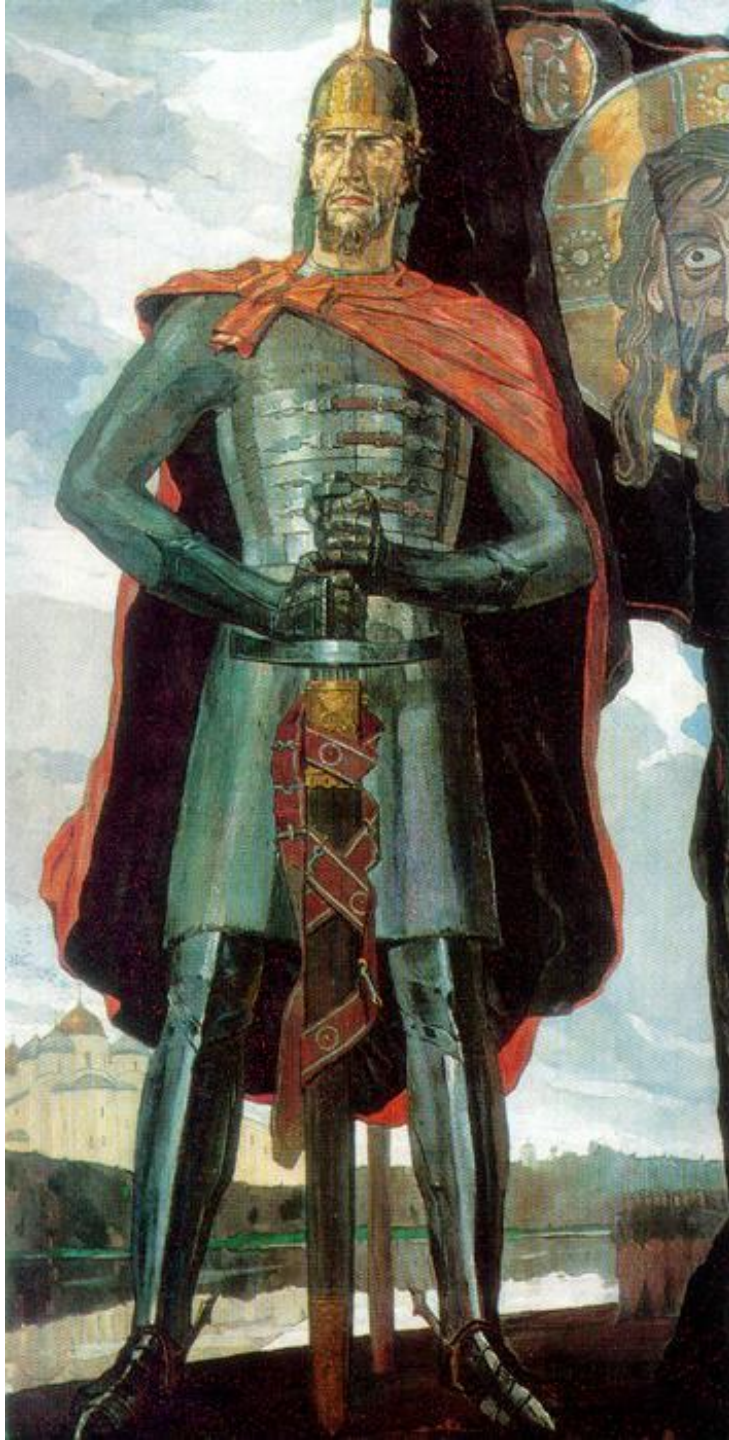
Александр Невский. Картина Павла Корина. 1942 г. Фрагмент