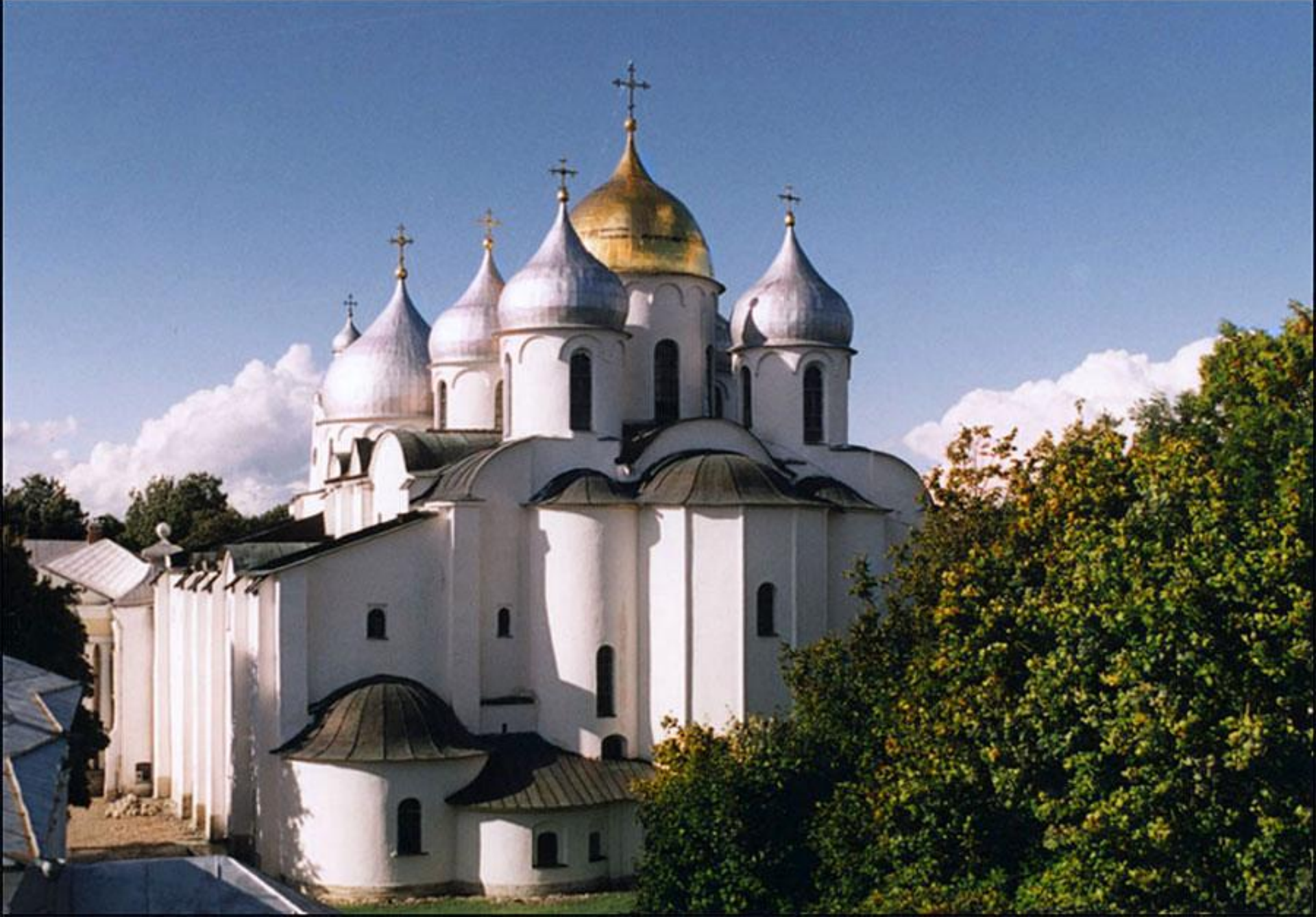
Новгородский Софийский собор. Построен в 1045–1050 гг.