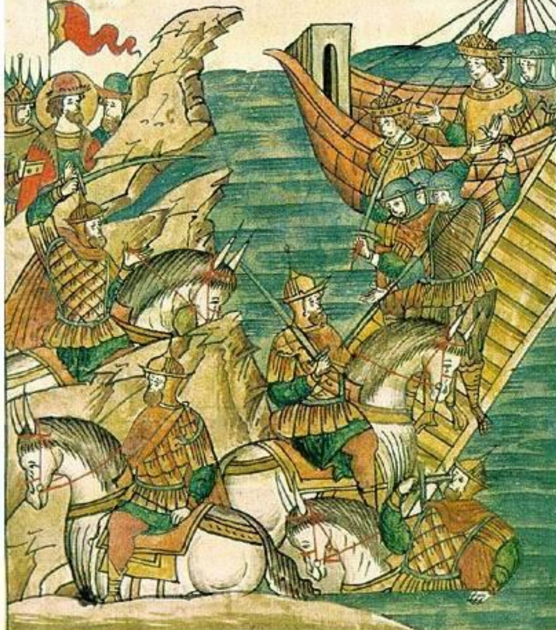
Невская битва. Миниатюра из Жития Александра Невского. XIII в.