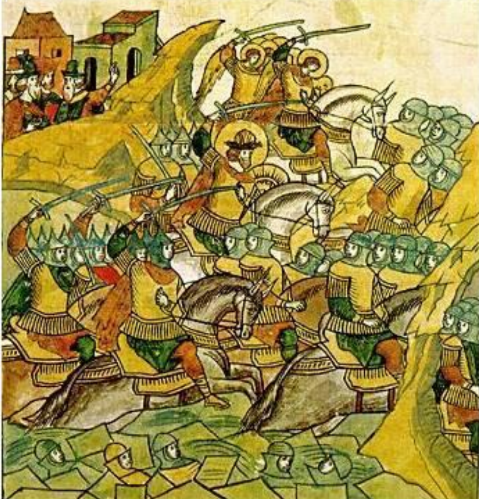
Ледовое побоище. Миниатюра из Жития Александра Невского. XIII в.