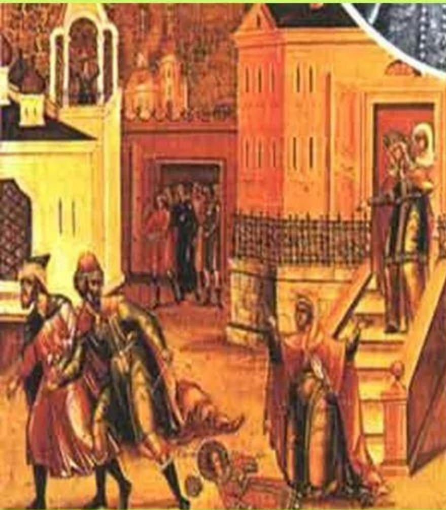
Убийство царевича Дмитрия. Миниатюра XVII века