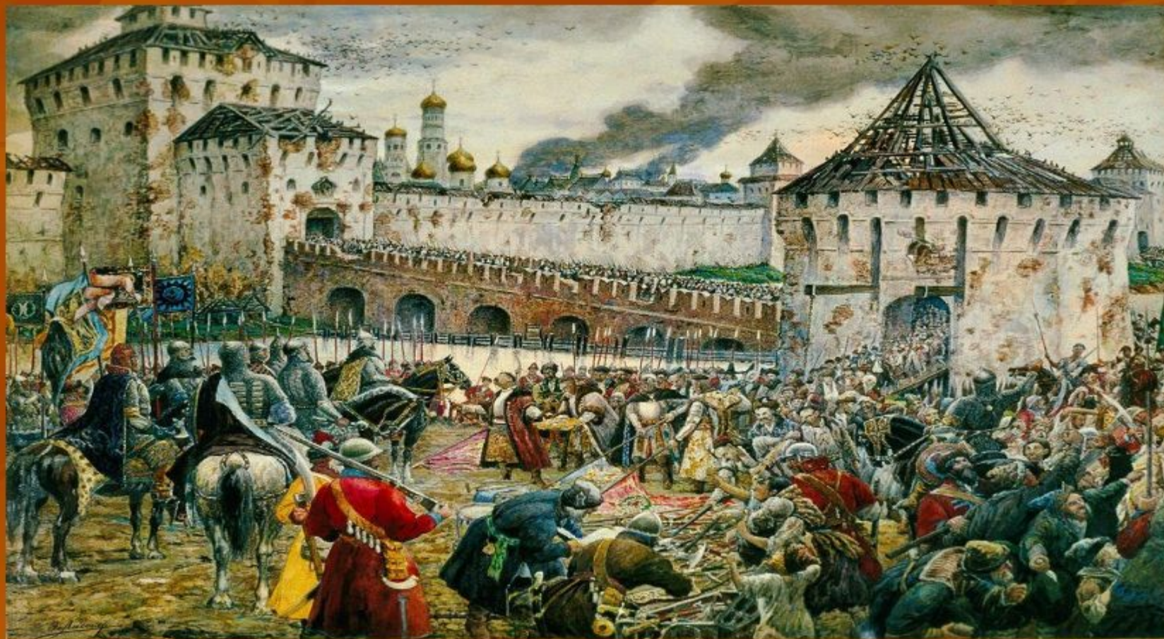
Э.Э.Лиснер. «Изгнание поляков из Кремля»

4 ноября 1612 года объединёнными усилиями народных ополчений в ходе ожесточённых боёв от польских захватчиков был освобождён Китай-город. После этого их кремлёвский гарнизон сдался, и Москва была окончательно освобождена от врагов.