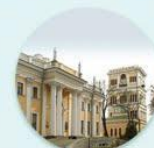
Гомельский дворцово-парковый комплекс