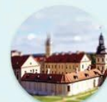
Национальный историко-культурный музей-заповедник "Несвиж"