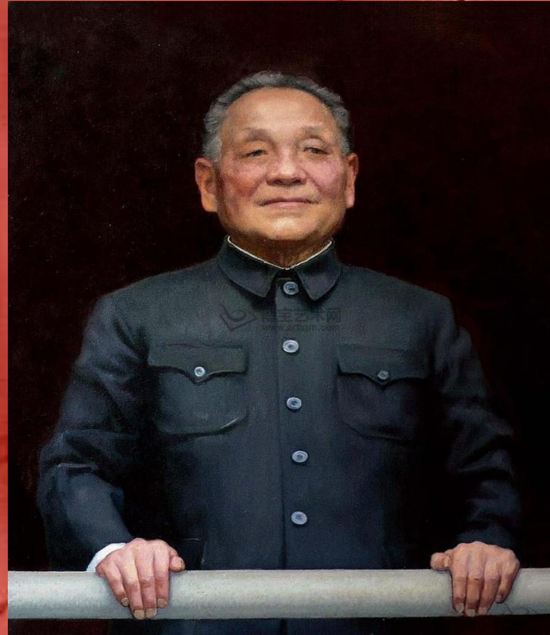
ДЭН СЯОПИН (1976-1989 ГГ.)