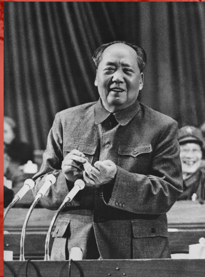
МАО ЦЗЭДУН (1893—1976 ГГ.)

МНОГИЕ СТАТЬИ И РЕЧИ МАО ЦЗЭДУНА СОСТАВЛЕНЫ В КОНФУЦИАНСКОМ ДУХЕ. ХОТЯ В 70-Е ГГ. XX СТОЛЕТИЯ «ВЕЛИКИЙ КОРМЧИЙ» И УТВЕРЖДАЛ, ЧТО ЕГО УЧИТЕЛЯМИ ЯВЛЯЮТСЯ ЛЕГИСТЫ, ОДНАКО В ЕГО ПРАКТИЧЕСКОЙ ДЕЯТЕЛЬНОСТИ ПРИСУТСТВОВАЛО КОНФУЦИАНСКОЕ ПРЕНЕБРЕЖЕНИЕ ПРАВОМ. ИЗ УВЛЕЧЕНИЯ ЛЕГИЗМОМ «...МАО ЦЗЭДУН ВЫВОДИЛ НЕ ПРИОРИТЕТ ЗАКОНА, А ПРИОРИТЕТ СИЛЫ. КРЕДО СИЛОВОЙ БОРЬБЫ ОСТАЛОСЬ ДЛЯ НЕГО ГЛАВНЫМ НАВСЕГДА, ЧТО БЫЛО ВЫРАЖЕНО В ИЗВЕСТНОМ АФОРИЗМЕ «ВИНТОВКА РОЖДАЕТ ВЛАСТЬ».