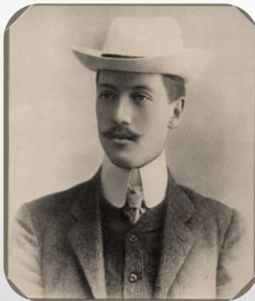
Н. Гумилев. Начало 1900-х годов,