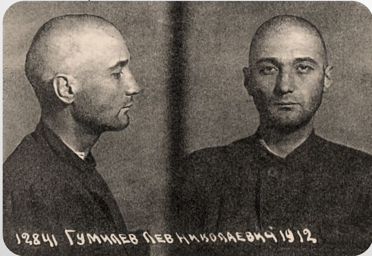
Фотография Л.Н. Гумилева из следственного дела (1949г.)

В течение всего 1950 года она пыталась выволить из рук сталинских палачей единственного сына, но безуспешно.