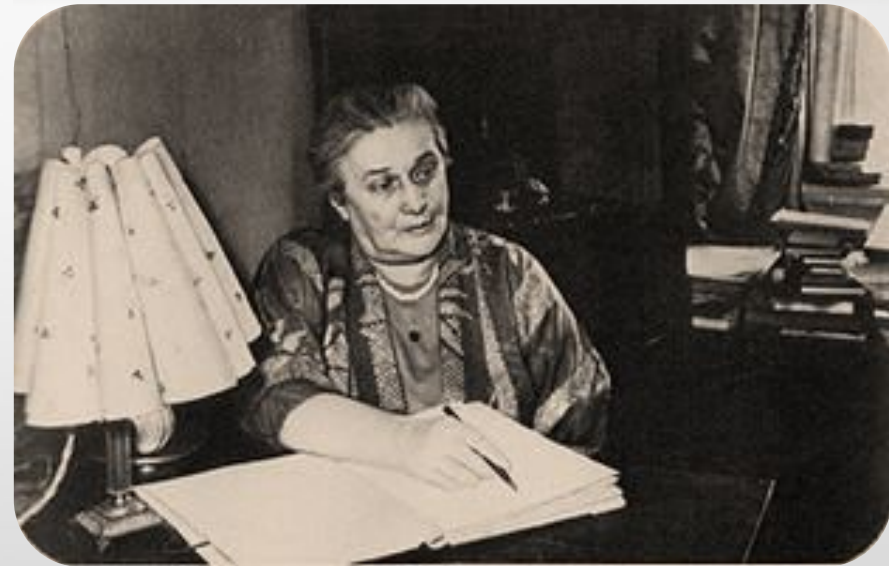
Анна Ахматова в своем рабочем кабинет. Конец 50-х годов.