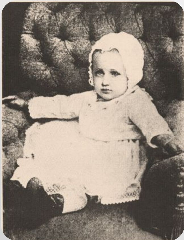
Анна Ахматова в детстве.

В 1890 году семья переехала в Царское Село. Здесь Ахматова стала ученицей Мариинской гимназии, но каждое лето проводила под Севастополем, где за смелость и своенравие получила прозвище «дикая девочка». По её собственным словам: