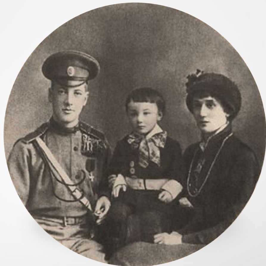
Анна Ахматова и Николай Гумилев с сыном Левой. 1915 год.

«Тоненькая, стройная, изящная, она ни на шаг не отходила от мужа, молодого поэта Н. С. Гумилева, который тогда же, при первом знакомстве, назвал ее своей ученицей. То было время ее первых стихов и необыкновенных, неожиданно шумных триумфов.»