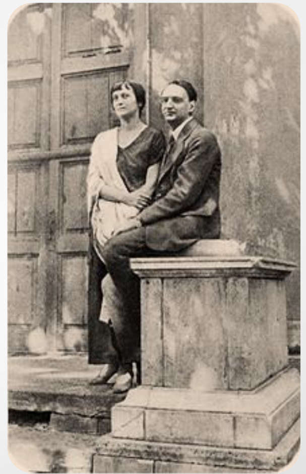
Анна Ахматова и Николай Пунин. 1927 год.