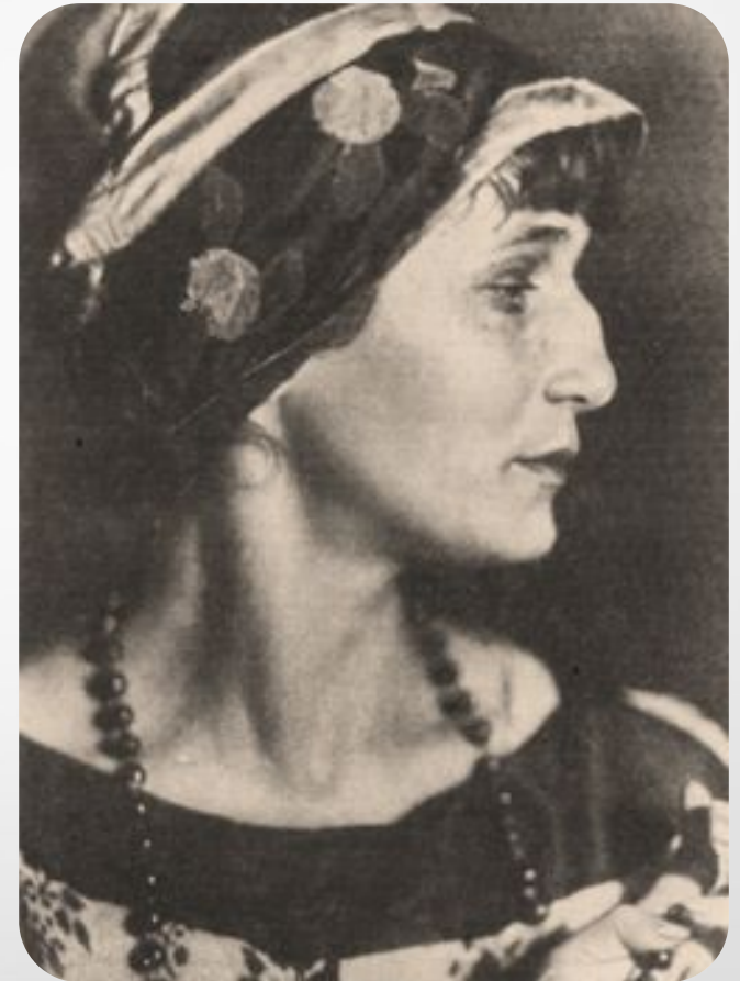
Анна Ахматова. 1920-е годы

Первые послереволюционные годы Ахматовой были отмечены острыми лишениями и отдалением от литературной среды. Однако после развода с Шилейко, смерти Блока и расстрела Гумилева осенью 1921 года она вернулась в "мир живых людей", начала участвовать в литературных вечерах, в работе писательских организаций, публикуется в периодических изданиях. В этом же году читатели увидели ещё два сборника её стихов: "Подорожник" и "Anno Domini".