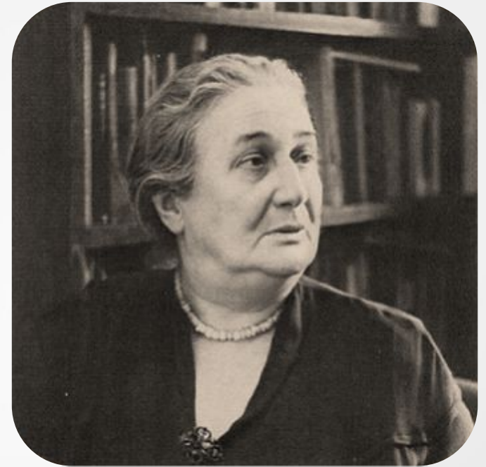
Анна Ахматова. 60-е годы

Роковая минута наступила совершенно неожиданно. На следующее утро после приезда в санаторий, 5 марта 1966 года, в присутствии врачей и сестер, пришедших в палату, чтоб осмотреть ее и снять кардиограмму, ей стало плохо. Все средства, которыми располагает медицина, были пущены в ход. Но усилия оказались тщетными.