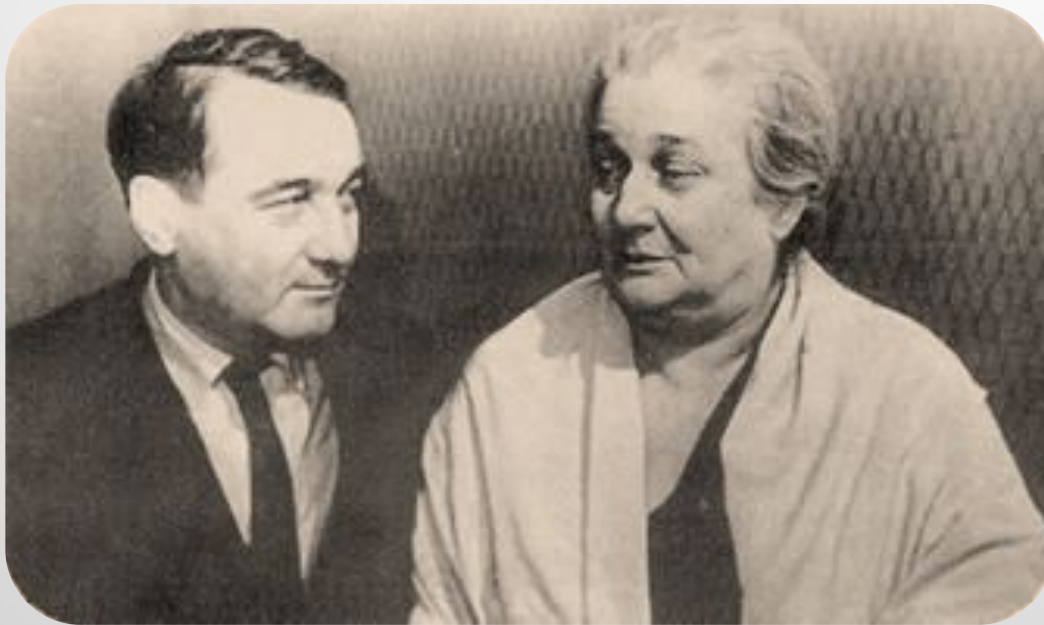
А. А. Ахматова и Л. Н. Гумилев. 1960 год.

15 апреля 1956 года вернулся из лагеря Лев Николаевич Гумилев.