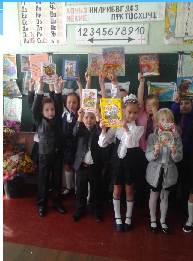
«Моя любимая книга»