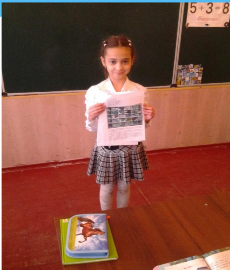
«Моя будущая профессия»