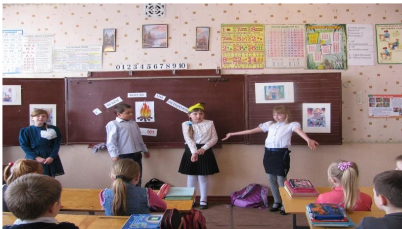
Сочиняем сказку « Жила – была спичка »