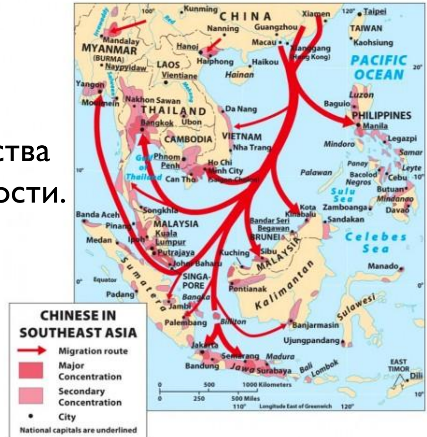
Figure 3.13