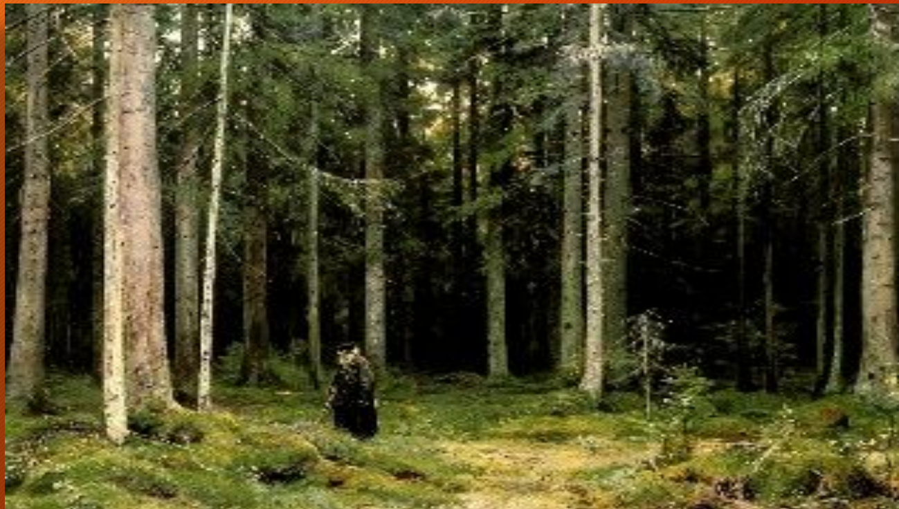
«В лесу графини Мордвиновой. Петергоф»

Художник поэтически воспеваает величественную жизнь русского леса, настоящей лесной глуши. Картина «В лесу графини Мордвиновой. Петергоф» относится к числу лучших творений Шишкина. Она в очередной раз доказывает, что в изображении русской природы, русского леса у Шишкина нет соперников.