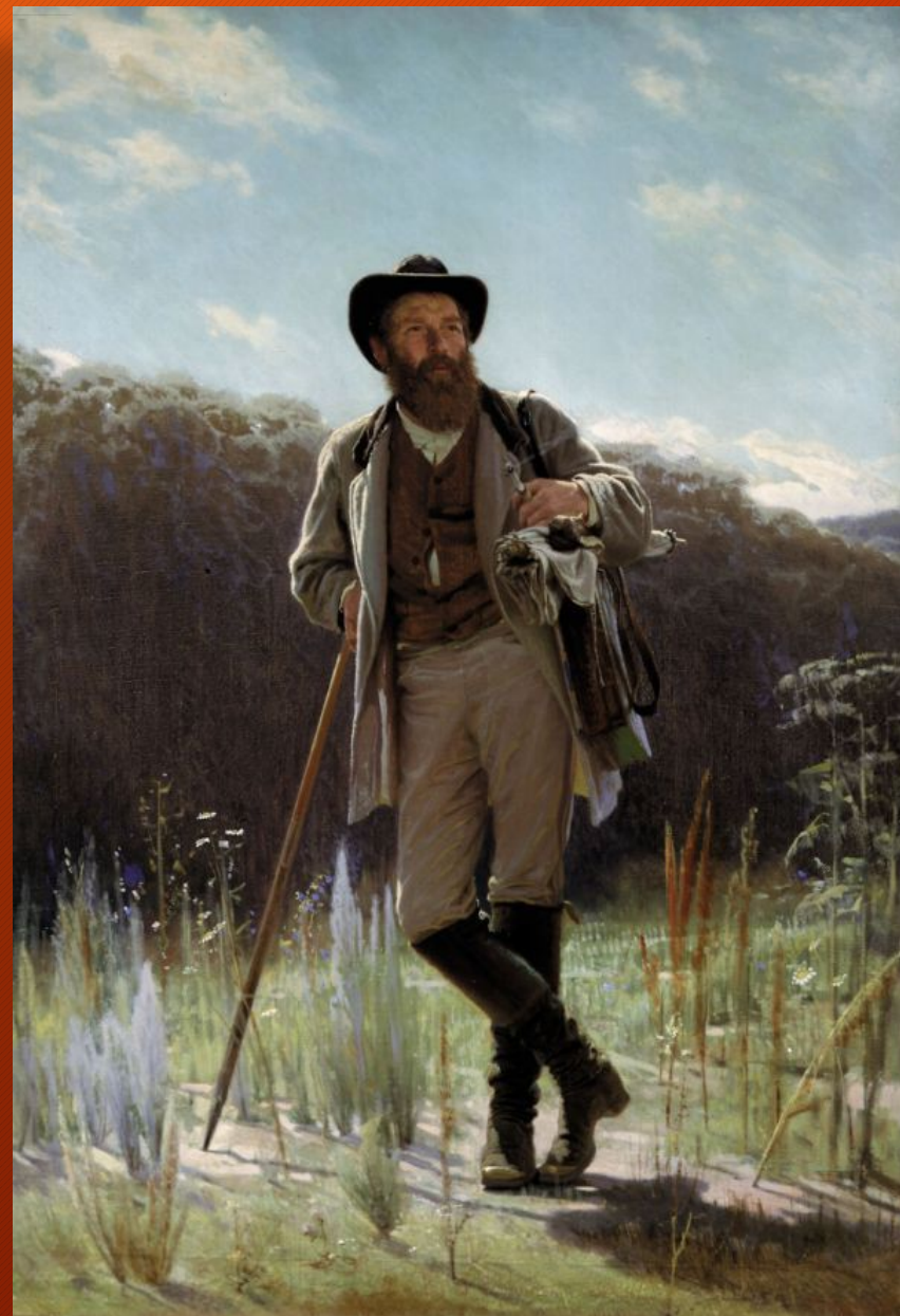
Иван Крамской (1837-1887). Портрет художника Ивана Ивановича Шишкина. 1873