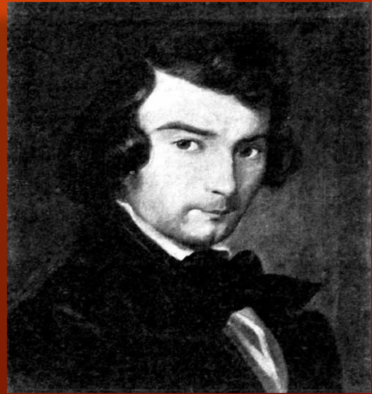
А. Н. Мокрицкий

После окончания курса (1856 г.) талантливому студенту посоветовали продолжить образование в Петербурге в Академии художеств. Его обучением руководил С. М. Воробьёв.