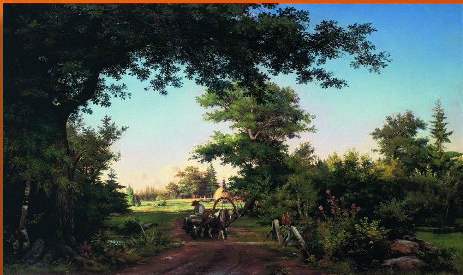
«Вид в окрестностях Петербурга» 1856 г. Масло.

Преподаватели сразу отметили склонность Шишкина к пейзажной живописи. Уже в первый год пребывания в академии ему была присуждена малая серебряная медаль за «Вид в окрестностях Петербурга». В 1858 г. художник получил Большую серебряную медаль за картину «Вид на острове Валааме».