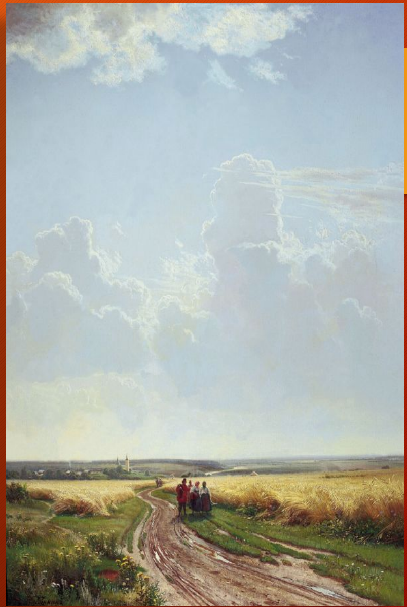
Полдень. В окрестностях Москвы

Полотно «Полдень. В окрестностях Москвы» недаром часто называют настоящей песней радости. Художник не просто восторгается красотой и мощью русских просторов, но и умело передает свое восхищение нам.