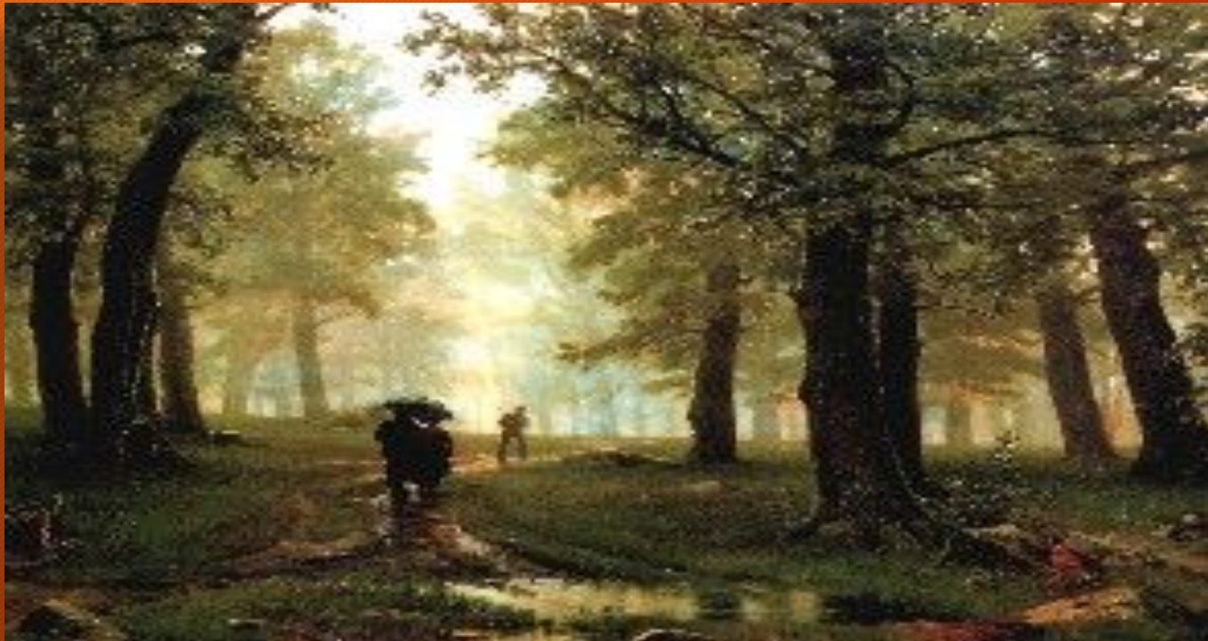
«Дождь в дубовом лесу»

Надо отметить, что полотно «Дождь в дубовом лесу» выпадает из череды картин художника, написанных в последние годы жизни, - эпических и даже несколько суровых по складу. Это - картина, в которой Шишкин будто забыл о тяготах и невзгодах, и с помощью таланта и вдохновения просто показал дивную прелесть окружающего мира.