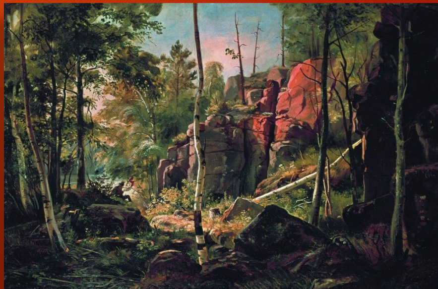
"Вид на острове Валаам." (Местность Кукко). 1859-1860 гг.