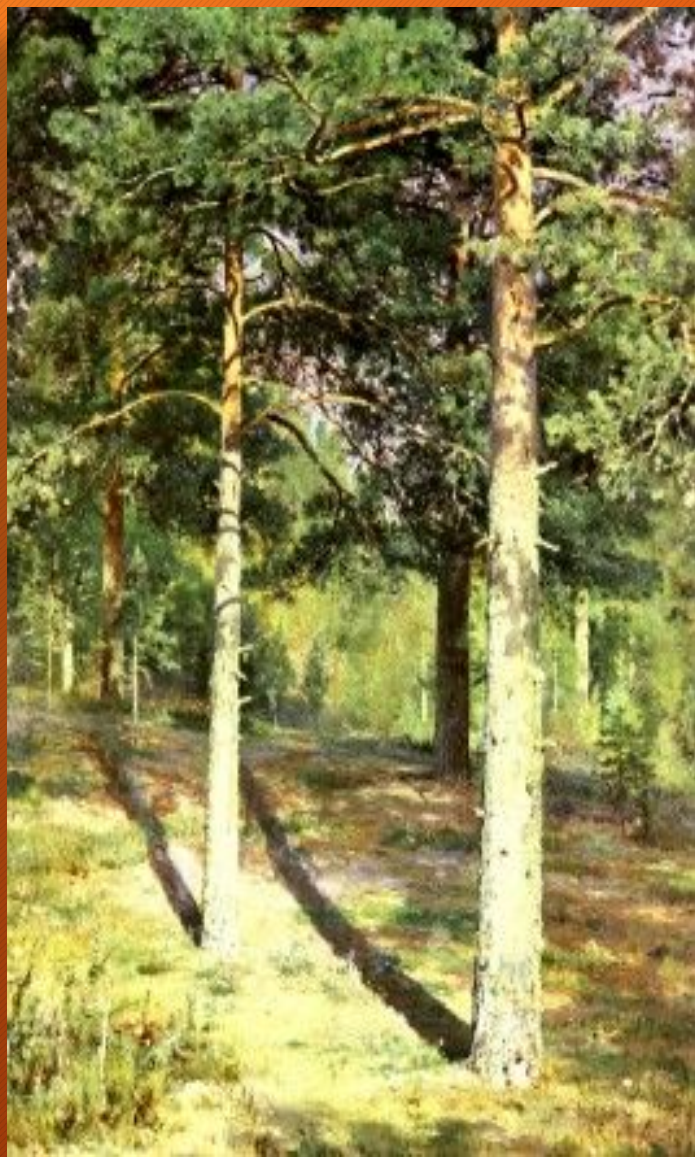
Сосны, освещенные солнцем

Картина «Сосны, освещенные солнцем» была написана И. И. Шишкиным в 1886 году.