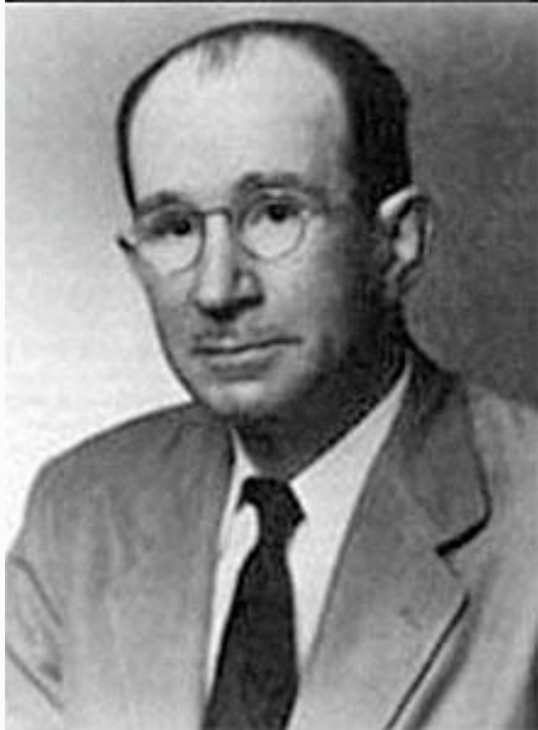
Гарри Салливан (1892-1949).

Теория Салливана - одна из попыток соединить все знания о личности, что были до этого.