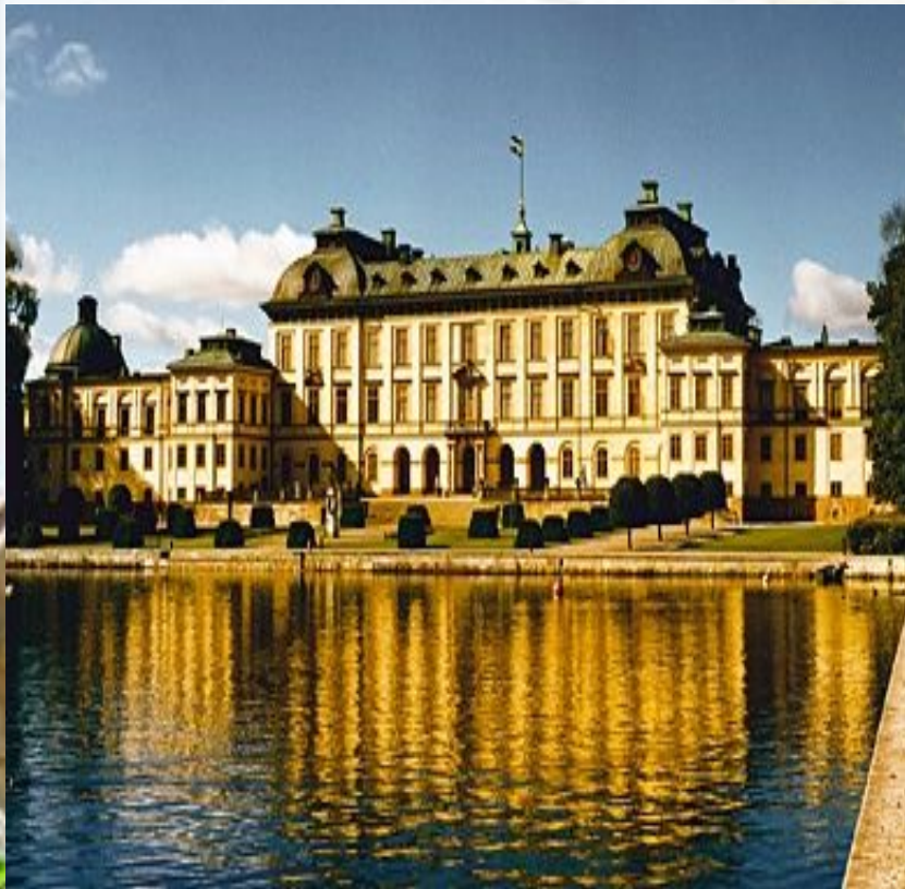
Королівський палац, Дроттнінгхольм