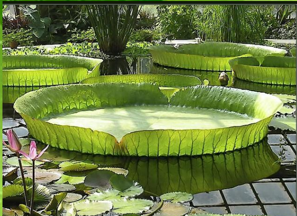
Виктория regia- диаметр листа 2,2 м

Листья разных растений не похожи друг на друга. Одни растения имеют крупные листья, а другие совсем