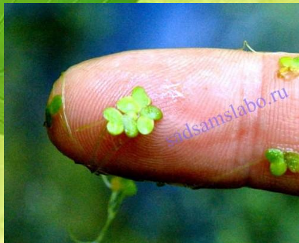
Ряска имеет самые маленькие плавающие листья