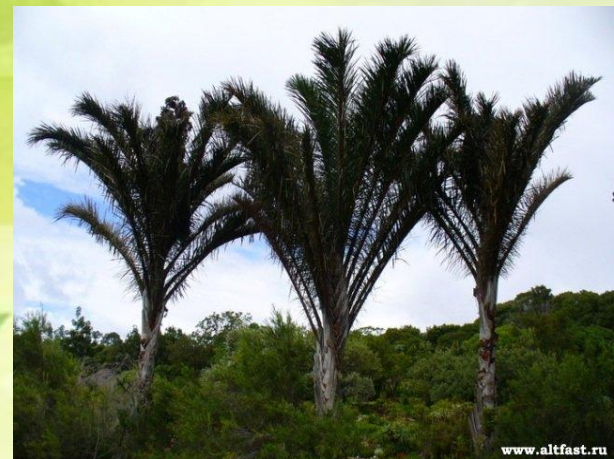
Пальма Рафия имеет лист длиной 20 м