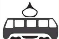
Автобус, троллейбус, трамвай