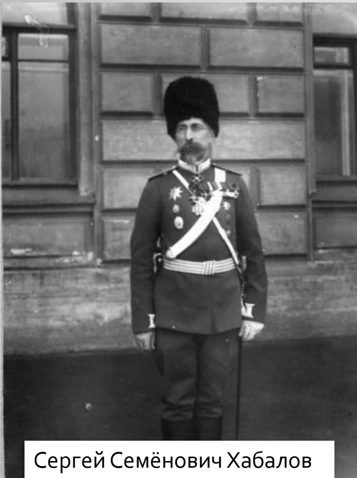
Сергей Семёнович Хабалов

Столичные власти сообщают, что не могут подавить бунт – Николай II отправляет в Петроград карательные войска (ген. Иванов Н.). Сам едет в Царское Село к семье. Ни тот, ни другой эшелоны не прошли – вернулись в Псков.