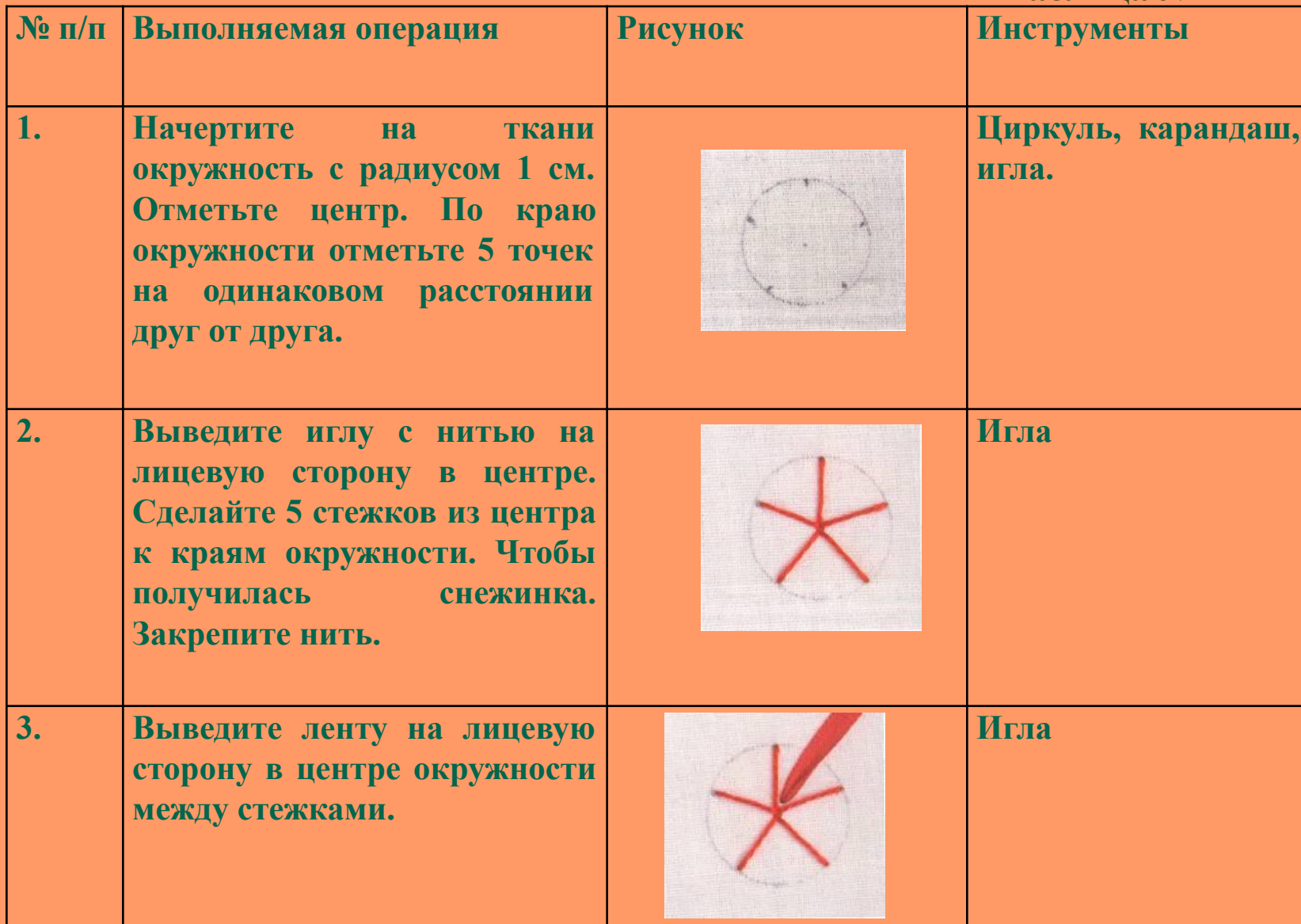
Таблица № 1