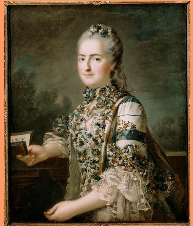
Мадам Луиза Французская