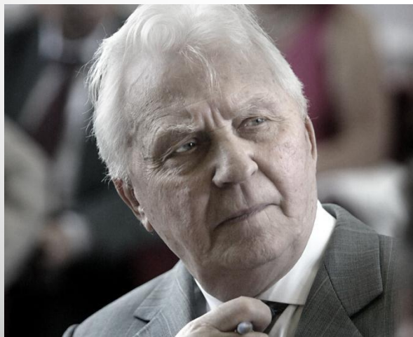
Александр Николаевич Яковлев