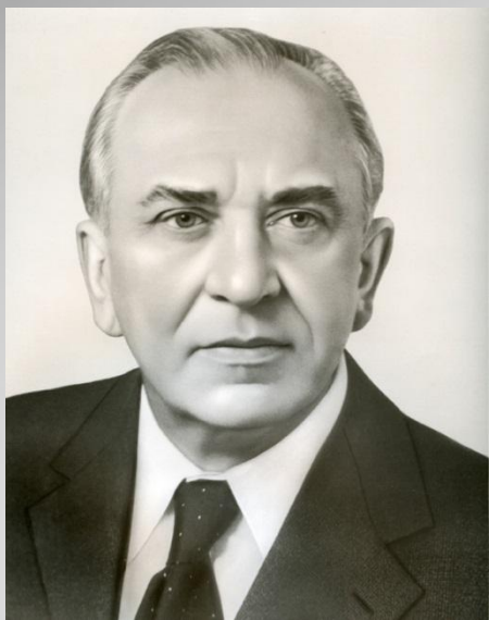
Виктор Васильевич Гришин