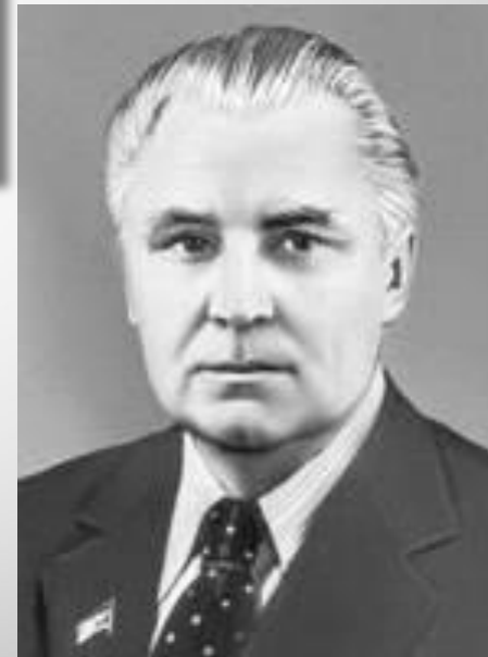
Владимир Васильевич Щербицкий