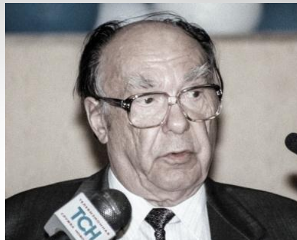
Эдуард Амвросиевич Шеварднадзе