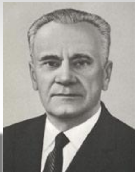
Тихонов Николай Александрович