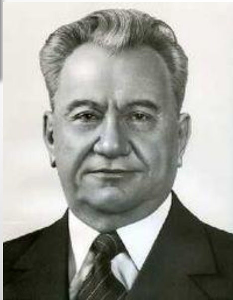
Динмухамед Ахмедович Кунаев