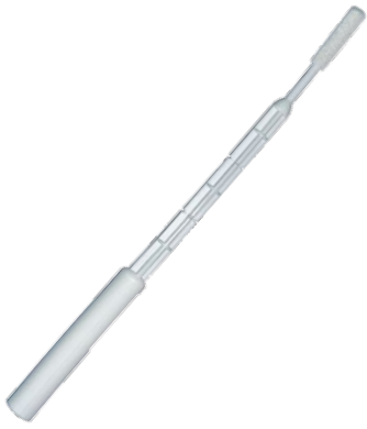
ЗОНД УРОГЕНИТАЛЬНЫЙ УНИВЕРСАЛЬНЫЙ (ТИП А)