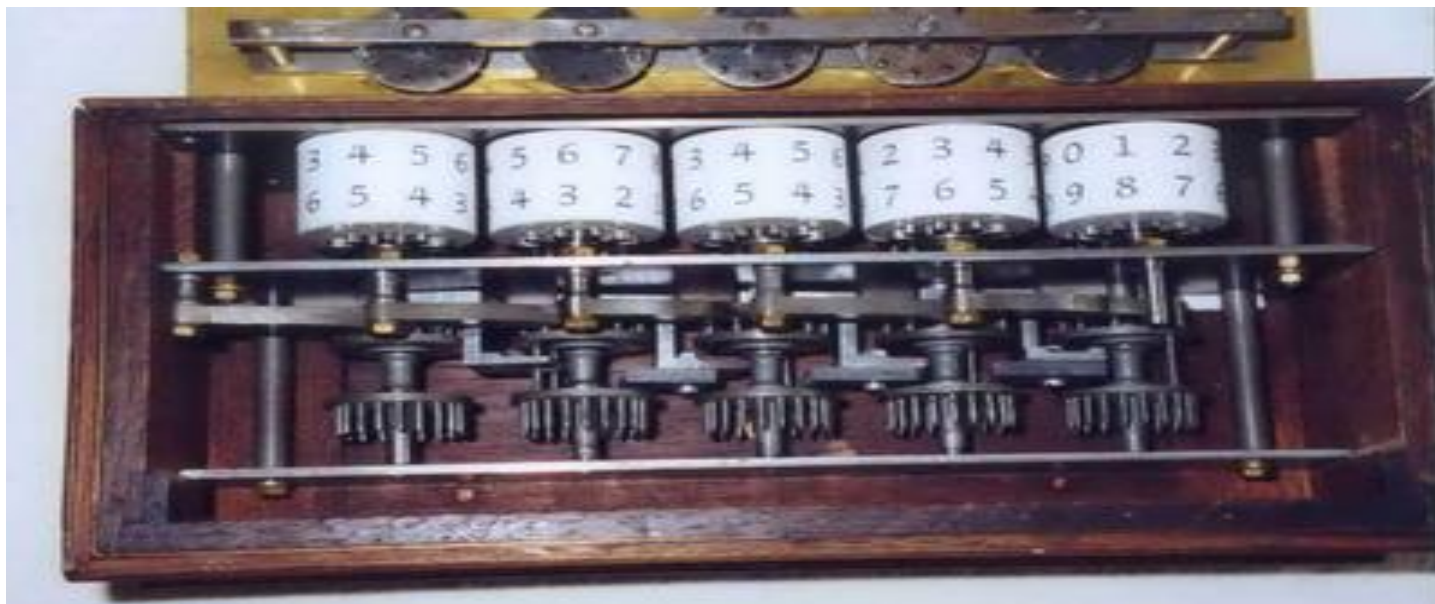
Вычислительная машина Блеза Паскаля