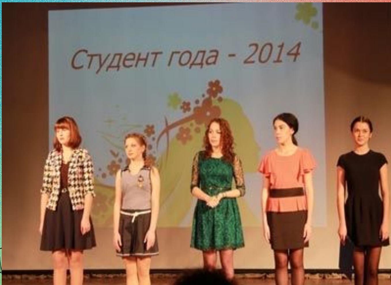
Рис 2. Студент года