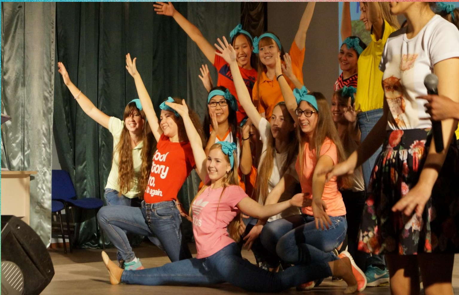
Рис 3. Мы молодые, мы талантливы