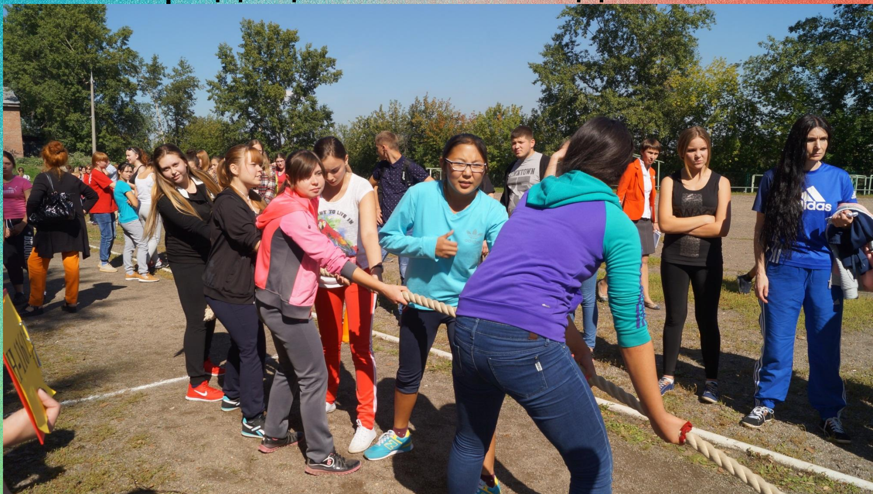
Рис 1. День здоровья