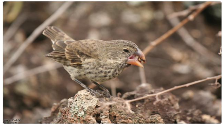
Земляной вьюрок Galapagos Journey.