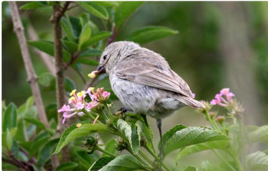
Большой кактусовый вьюрок Galapagos Journey.