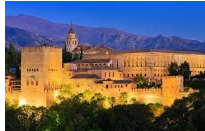
Granada , la capital de España desde 1499 y hasta febrero de 1502