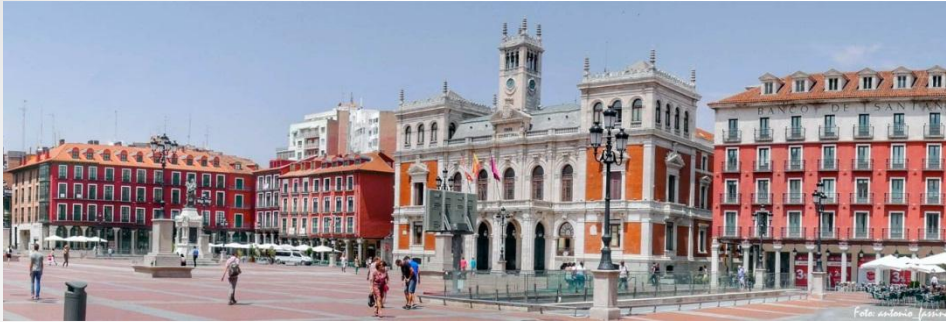
Valladolid , entre 1601 y 1606, fue capital del Imperio español