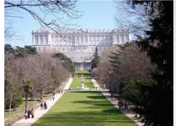
Madrid , la capital de España desde 1561