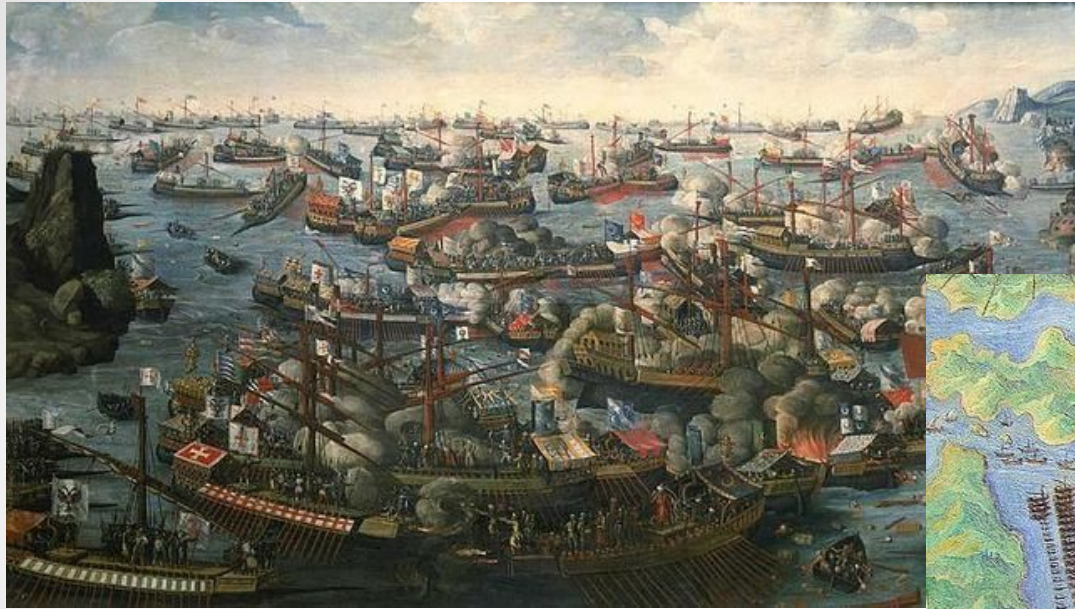
Fresco de la batalla en el museo del Vaticano