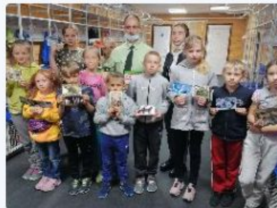
Экопросвещение юных «Олимпийцев» Уватского района