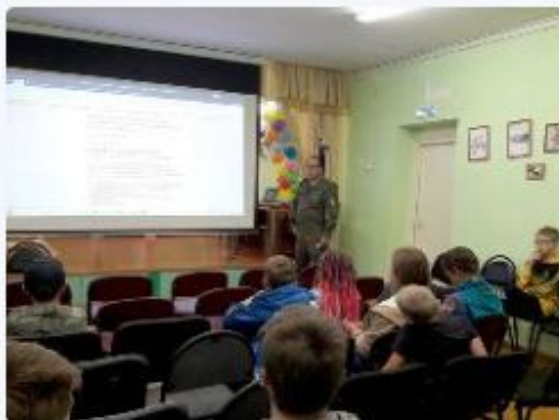
Особо охраняемые природные территории Ярковского района