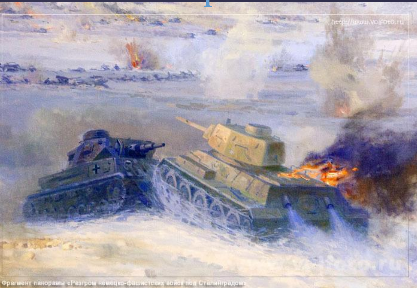
Фрагмент панорамы «Разгром немецко-фашистских войск под Сталинградом»