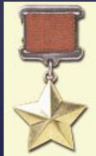
Медаль "Золотая Звезда"