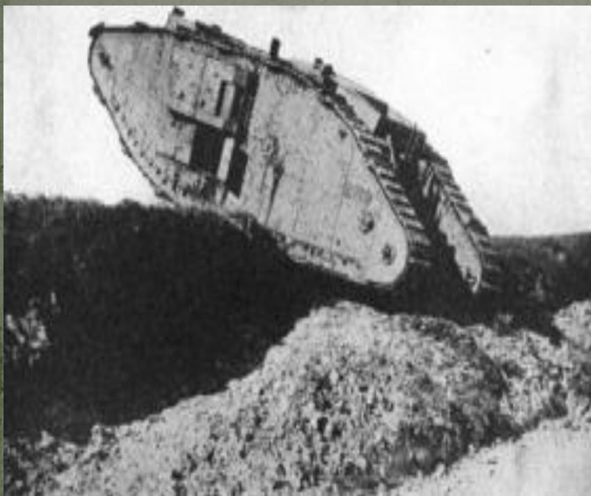
Британский танк пересекает германскую траншею