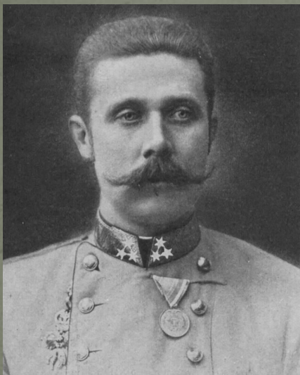
Эрцгерцог Франц Фердинанд

Общепринято, что непосредственно поводом к началу военных действий явилось Сараевское убийство 28 июня 1914 г. эрцгерцога Франца Фердинанда сербским националистом Гаврило Принципом.