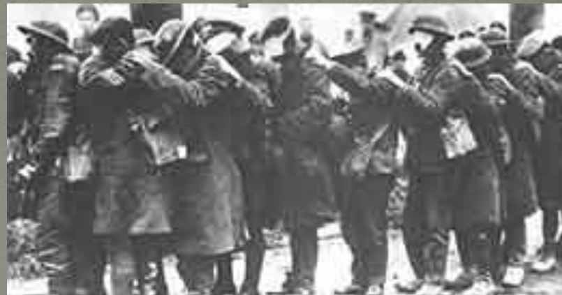
Пострадавшие от газовой атаки английские солдаты