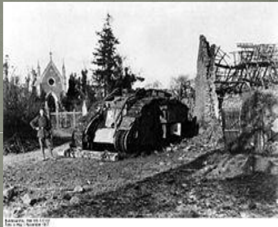
Подбитый английский танк