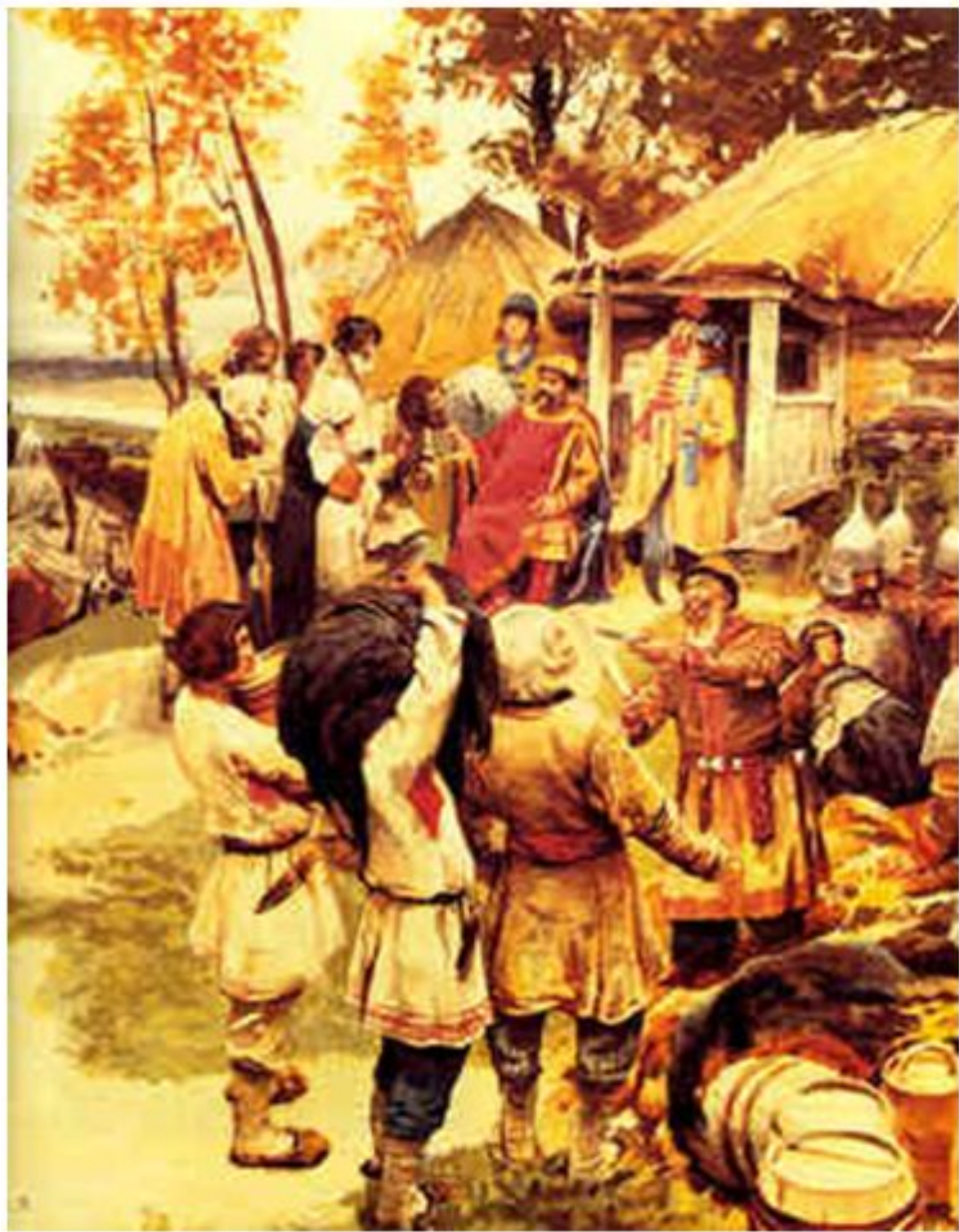
Рисунок - Полюдье