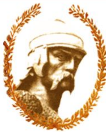
Рисунок - Князь Святослав

После того, как сын Ольги и Игоря Святослав «взошел в возраст», он стал новым киевским князем.