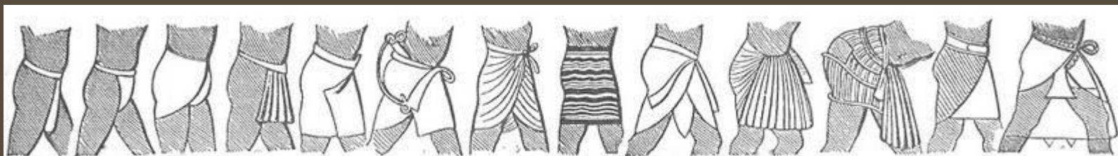
Варианты повязок и схенти