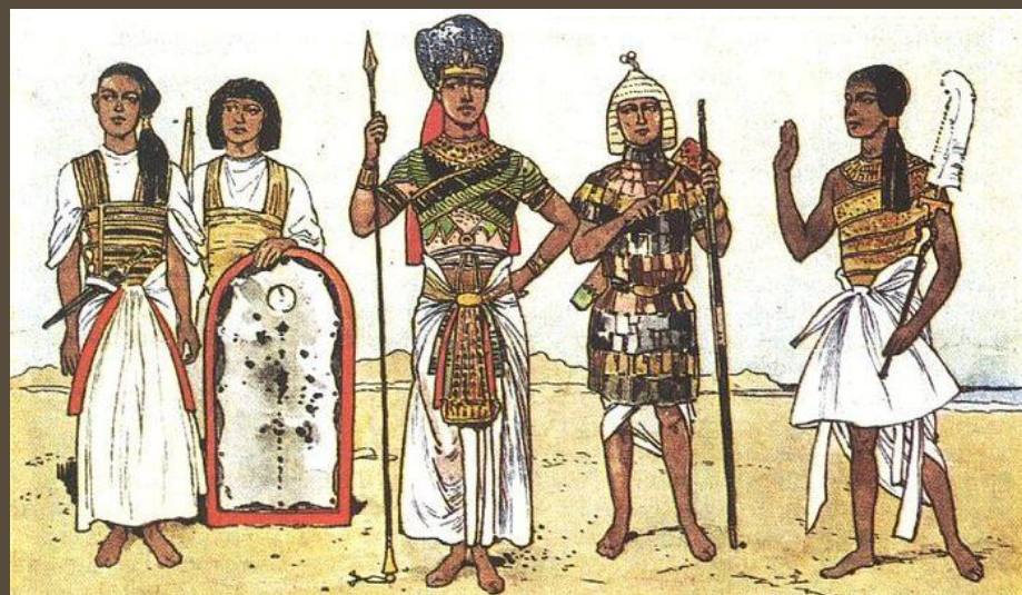
Фараон и его приближенные