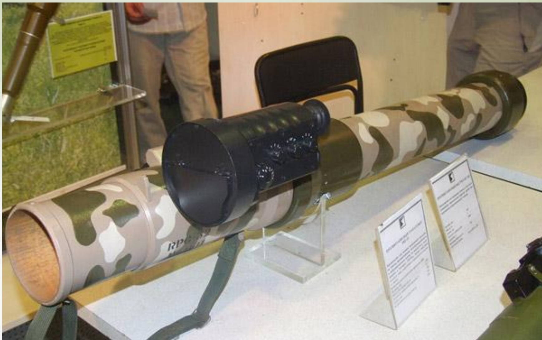
РПГ-32 Хаши́м — многофункциональный ручной противотанковый гранатомет