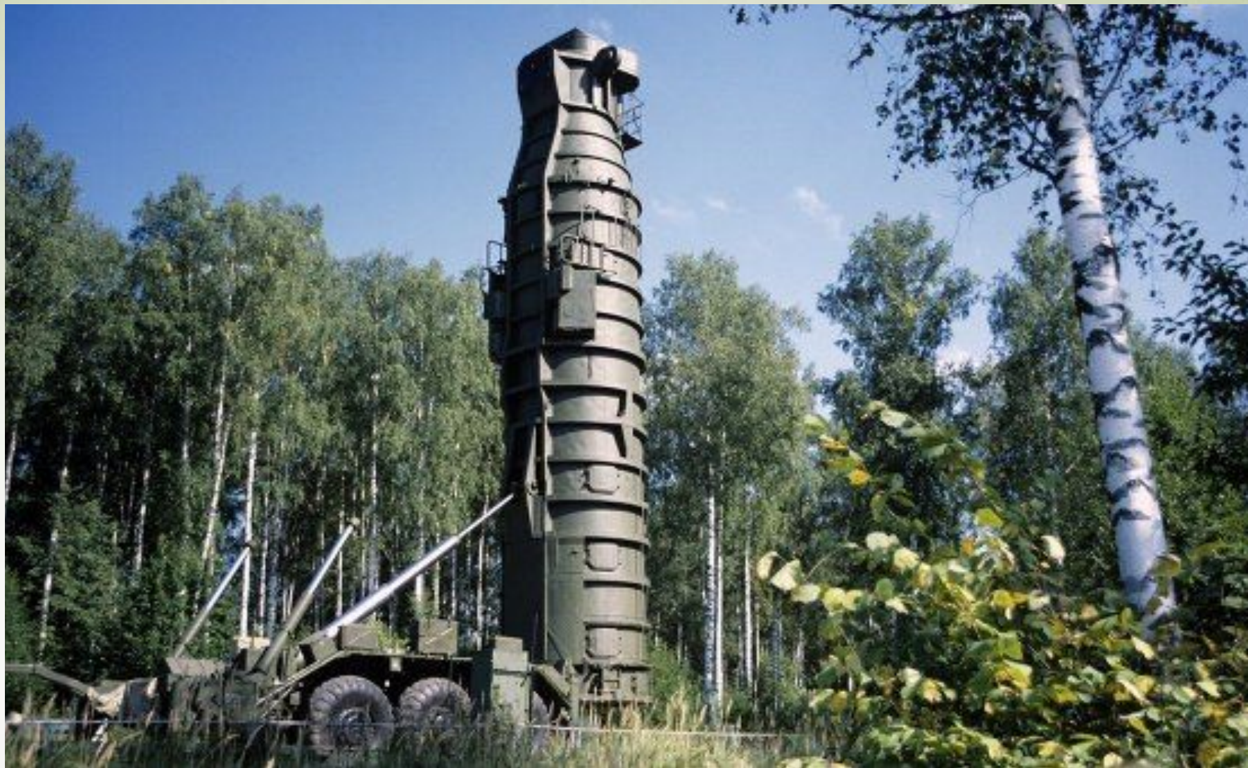
Перспективная тяжелая МБР «Сармат» РС-28 – ракета нового поколения