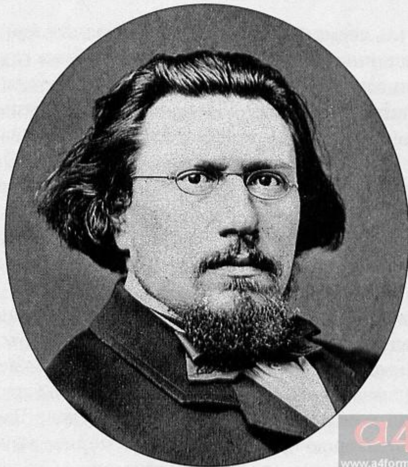
Н.С. Лесков. Фото 1864

Вышли произведения Лескова, « Леди Макбет Мценского уезда » (1864), « Воительница » (1866) — повести, в основном, трагического звучания, в которых автор вывел яркие женские образы разных сословий . Современной критикой практически оставленные без внимания, впоследствии они получили высочайшие оценки специалистов. Именно в первых повестях проявился индивидуальный юмор Лескова, впервые стал складываться его уникальный стиль, разновидность «сказа» .