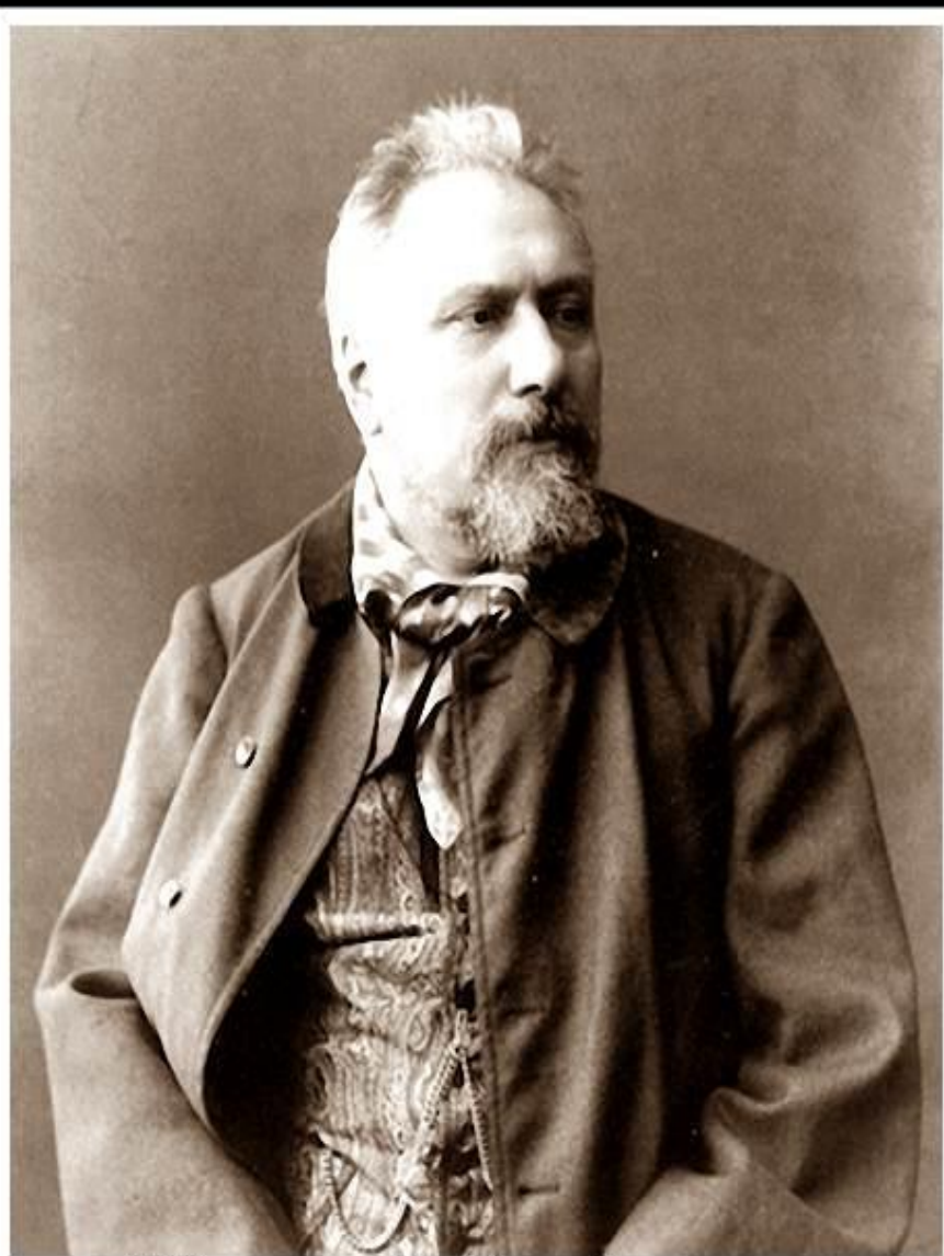
Николай Семёнович Лесков

Николай Семёнович Лесков — уроженец Орловской губернии. Дед Лескова был священник, бабушка — купчиха, отец — чиновник, мать — дворянка; таким образом, писатель объединил в себе кровь четырёх сословий, но очень вероятно, что наиболее глубокое влияние оказал на него человек пятого сословия — солдатка - нянька , крепостная, рассказами которой он часто заслушивался.