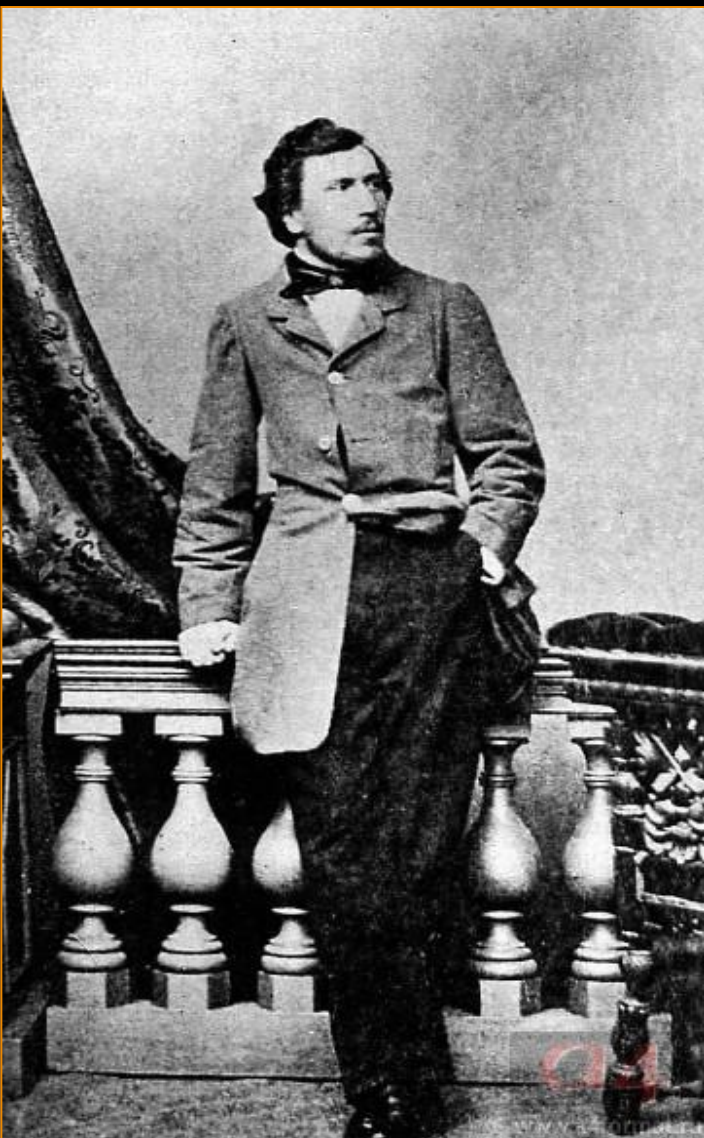
Н.С. Лесков. Фото 1860

Лесков начал печататься сравнительно поздно, на двадцать девятом году жизни, поместив несколько заметок в газете «Санкт-Петербургские ведомости» (1859—1860)... Статьи Лескова, обличавшие коррупцию полицейских врачей, привели к конфликту с сослуживцами: в результате организованной ими провокации Лесков, проводивший служебное расследование, был обвинен во взяточничестве и вынужден был оставить службу. В начале своей литературной карьеры Н. С. Лесков сотрудничал со многими петербургскими газетами и журналами, более всего печатаясь в «Отечественных записках».