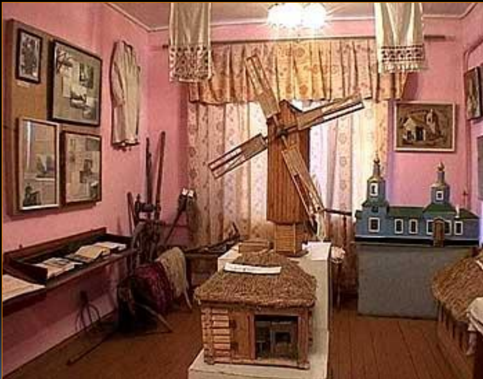
ЭКСПОЗИЦИЯ ОРЛОВСКОГО МУЗЕЯ