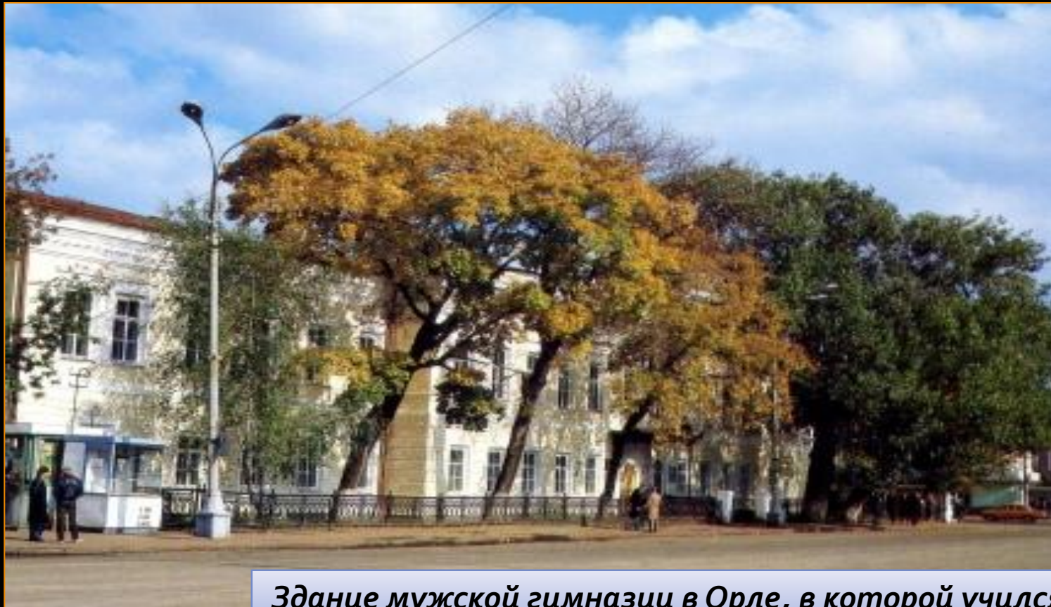
Здание мужской гимназии в Орле, в которой учился Н. С. Лесков

В августе 1841 года в десятилетнем возрасте Н. С. Лесков поступил в первый класс Орловской губернской гимназии, где учился плохо: через пять лет он получил свидетельство об окончании лишь двух классов.