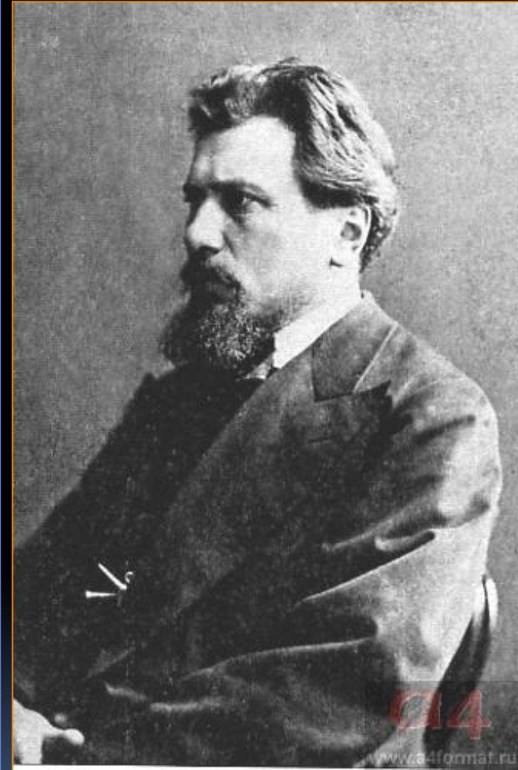
Н.С. Лесков. Фото 1875

В 1872 году был написан, а год спустя опубликован рассказ Н. С. Лескова « Запечатленный ангел », повествовавший о чуде, приведшем раскольничью общину к единению с православием. В том же году вышла повесть « Очарованный странник », произведение свободных форм, не имевшее законченного сюжета, построенное на сплетении разрозненных сюжетных линий. Впоследствии отмечалось, что образ героя Ивана Флягина напоминает былинного Илью Муромца и символизирует «физическую и нравственную стойкость русского народа среди выпадающих на его долю страданий».