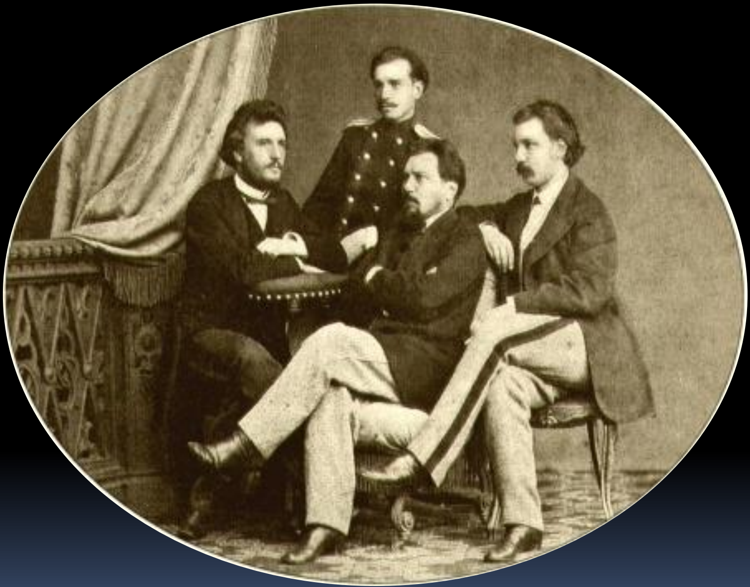
Н.С. Лесков с братьями. Фото 1860-х