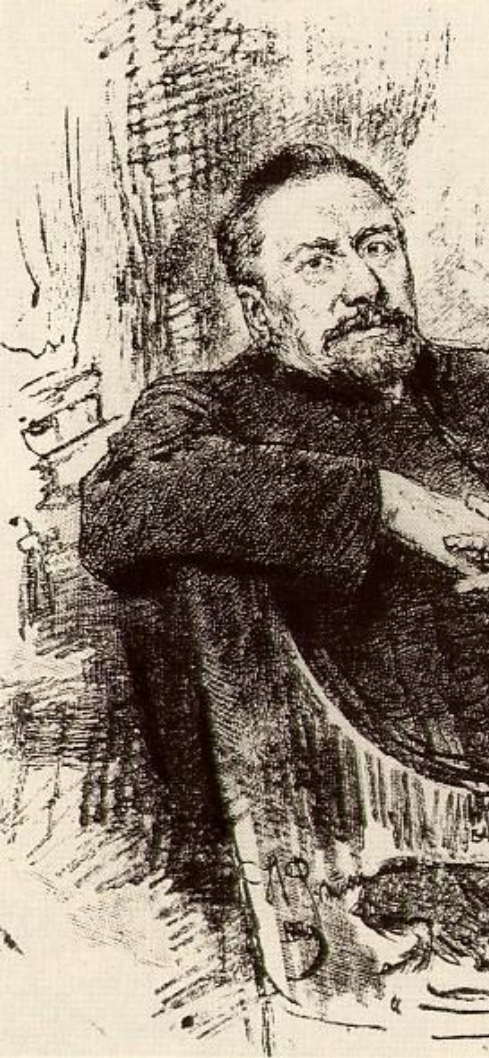
Н.С. Лесков. 1889. Гравюра В. Матэ по рисунку И. Репина