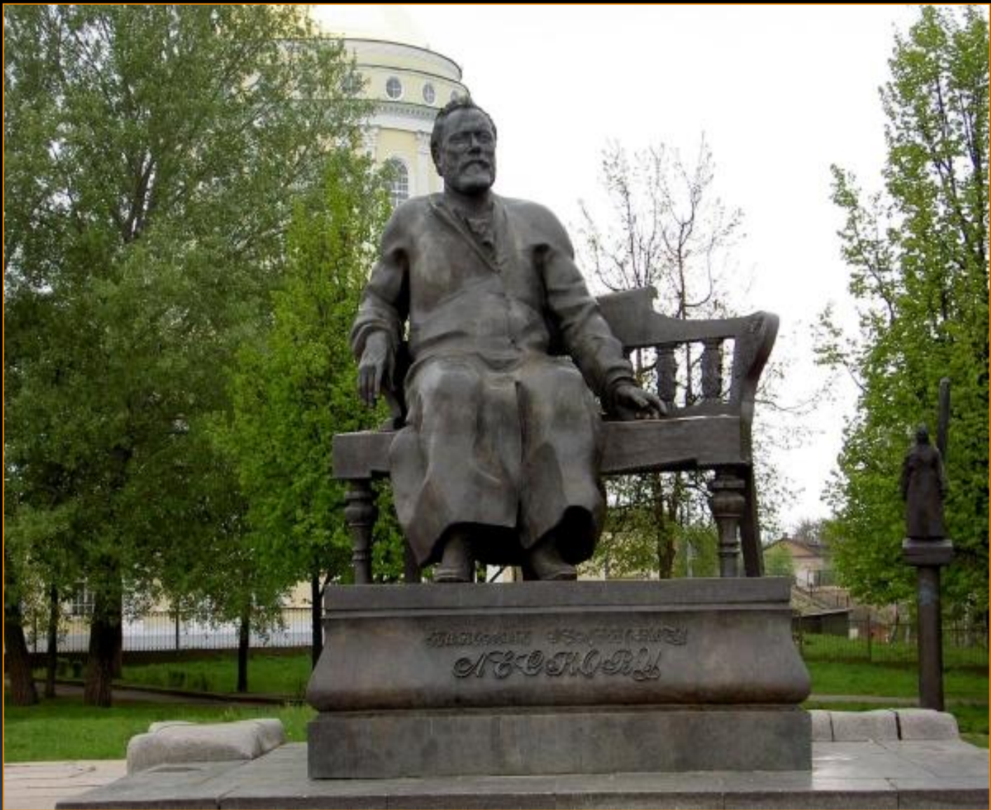
ПАМЯТНИК ПИСАТЕЛЮ В ОРЛЕ