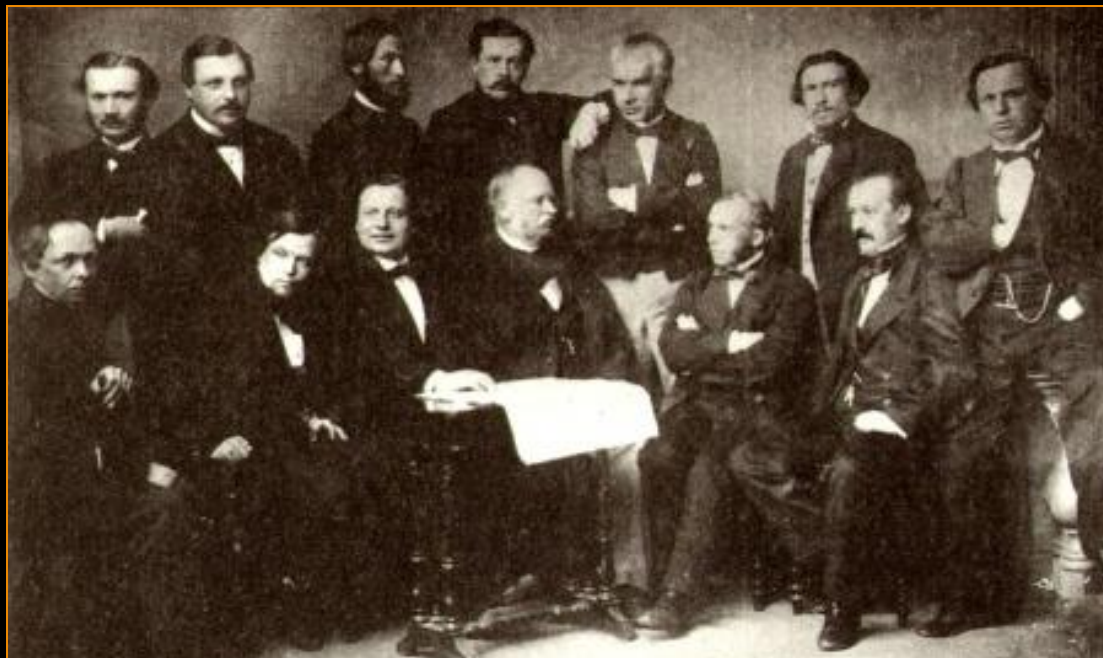
Н.С. Лесков (стоит второй справа) среди сотрудников газеты «Северная пчела». Фото начала 1860-х

С начала 1862 года Н. С. Лесков стал постоянным сотрудником газеты «Северная пчела», где начал писать как передовые статьи, так и очерки, нередко на бытовые, этнографические темы, но также — критические статьи.