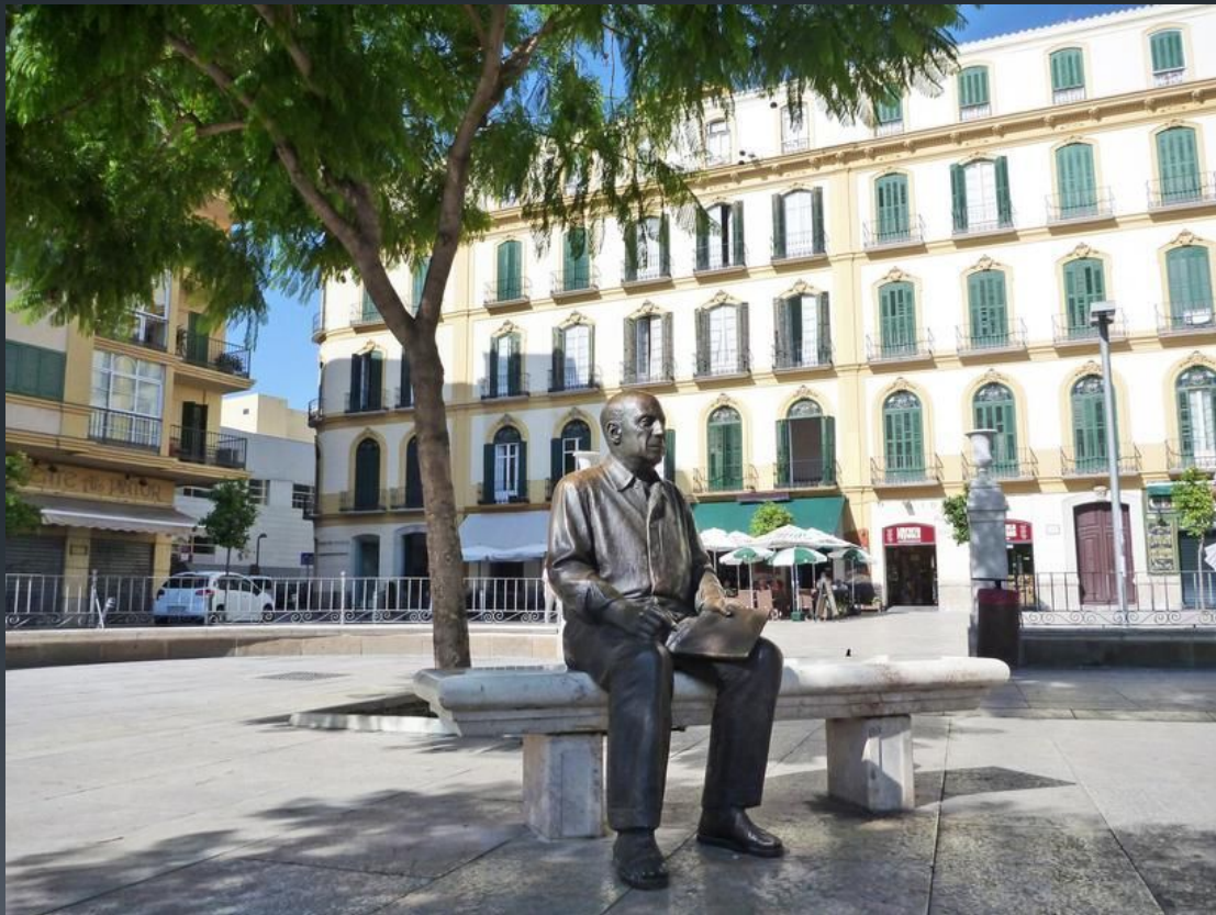
Будинок в якому народився Пікассо

Пабло Пікассо народився 25 жовтня 1881 року в місті Малага в іспанському регіоні Андалусія у родинній садибі небідного дона Руїса Бласко. Його охрестили як Пабло Дієго Хосе Франсіско де Паула Хуан Непомусено Марія де лос Ремедьйос Кріспіньяно де ла Сантісіма Трінідад .