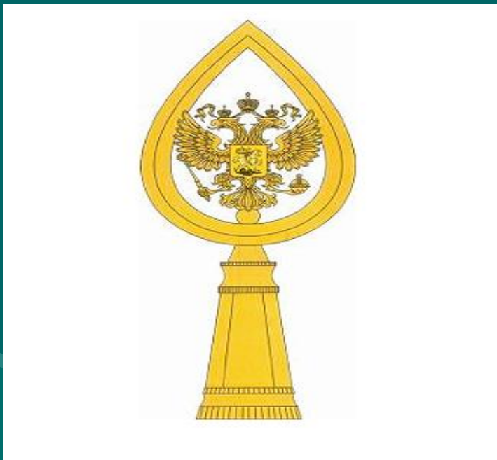
Навершие Боевого знамени

При присвоении воинской части наименования "гвардейская" ей вручаются георгиевские знаменные ленты и навершие.