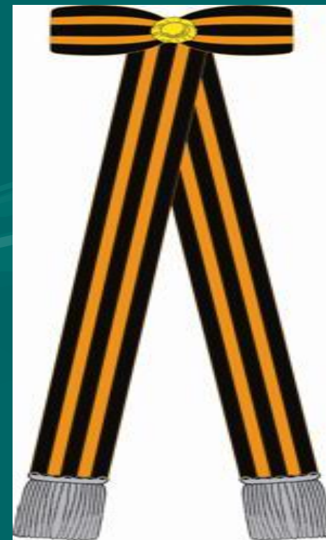
Георгиевская знаменная лента