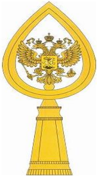
Навершие Боевого знамени

Навершие металлическое, золотистое (серебристое), в виде прорезного копья с рельефным изображением главной фигуры Государственного герба Российской Федерации. Высота навершия - 20 см.