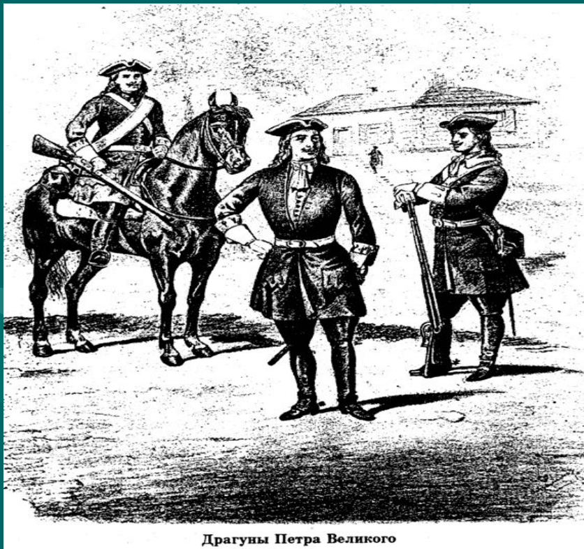
Драгуны Петра Великого

После принесения присяги в строю присягающие подписывали индивидуальные клятвенные обещания - "присяжные листы".