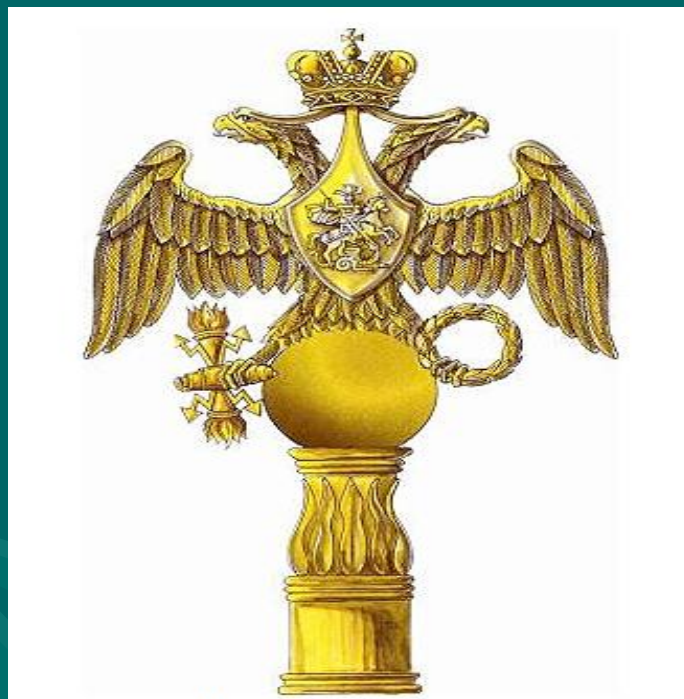
Навершие гвардейских воинских частей