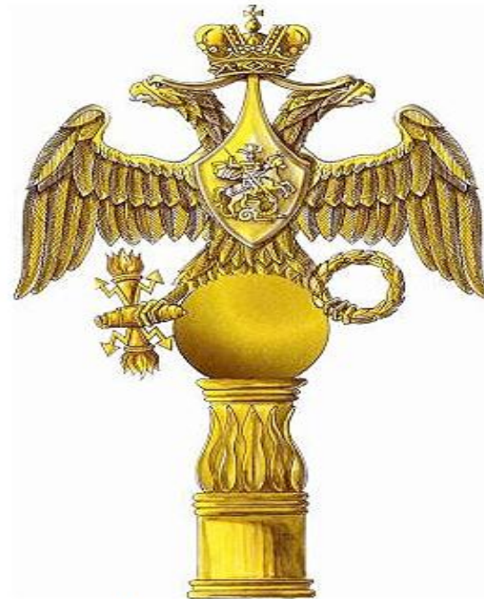
Навершие гвардейских воинских частей