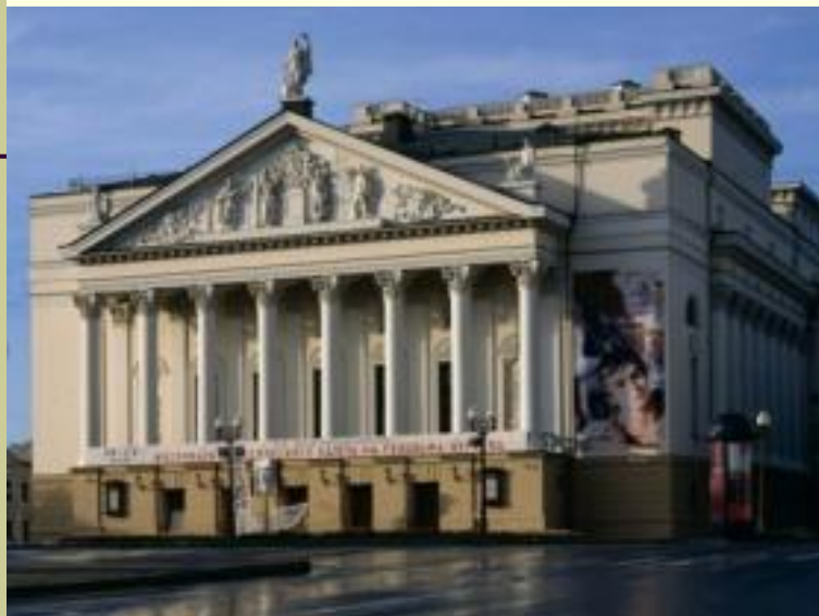
Большой оперный театр