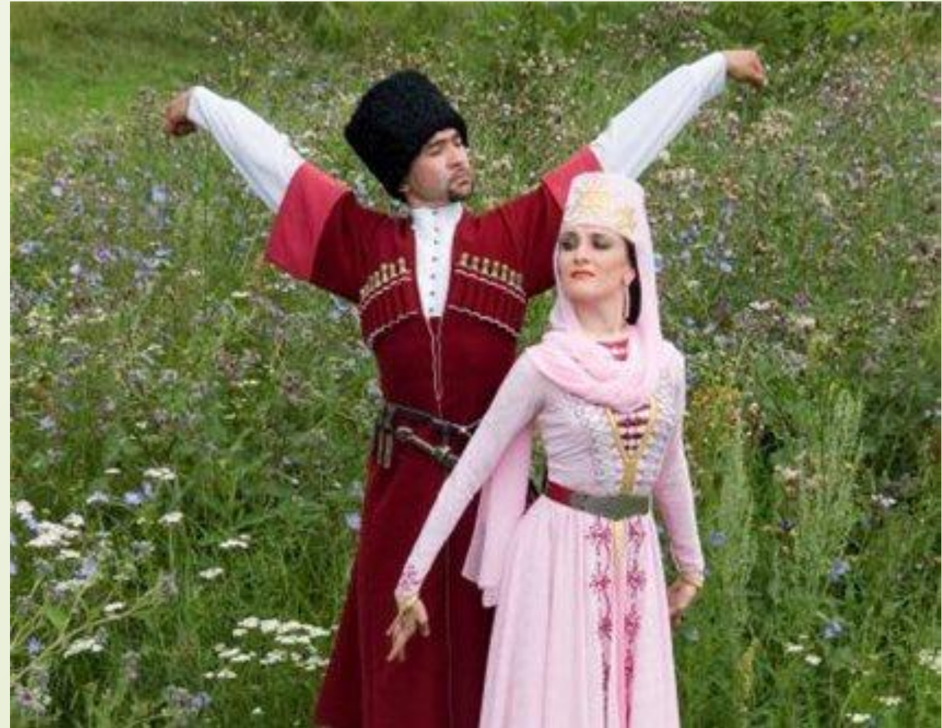
Народный костюм ингушей