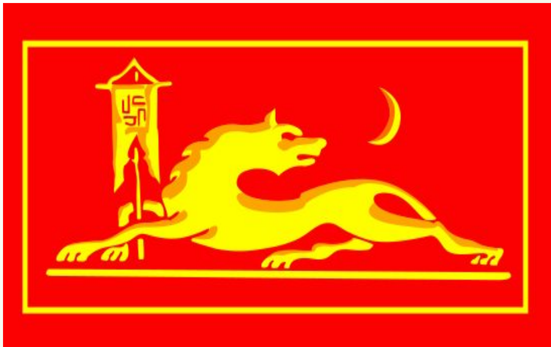
Герб аварских ханов (по грузинскому историку и путешественнику Вахушти Багратиони, XVIII век)