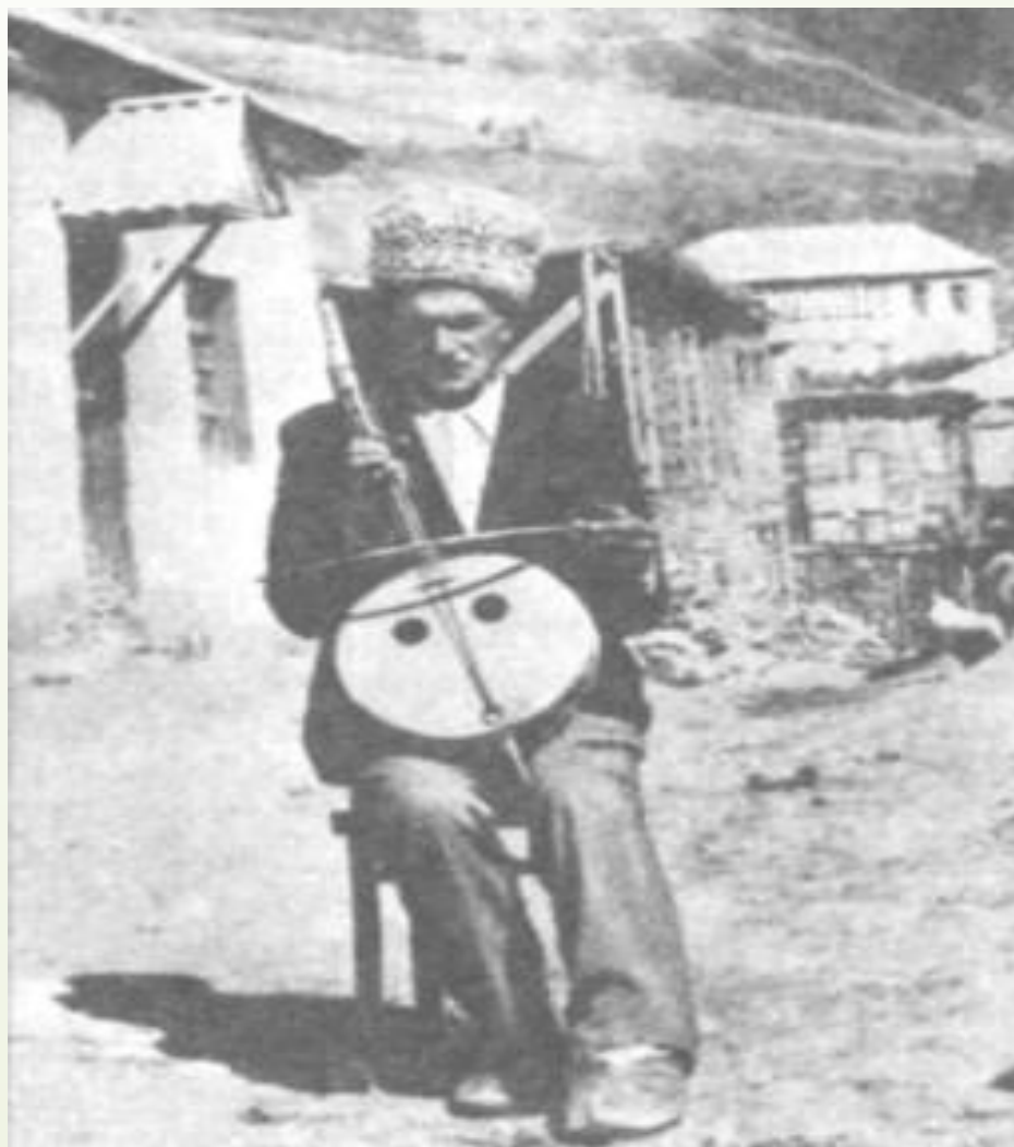
Национальный инструмент - чагана

Аварцы — самый многочисленный народ современного Дагестана