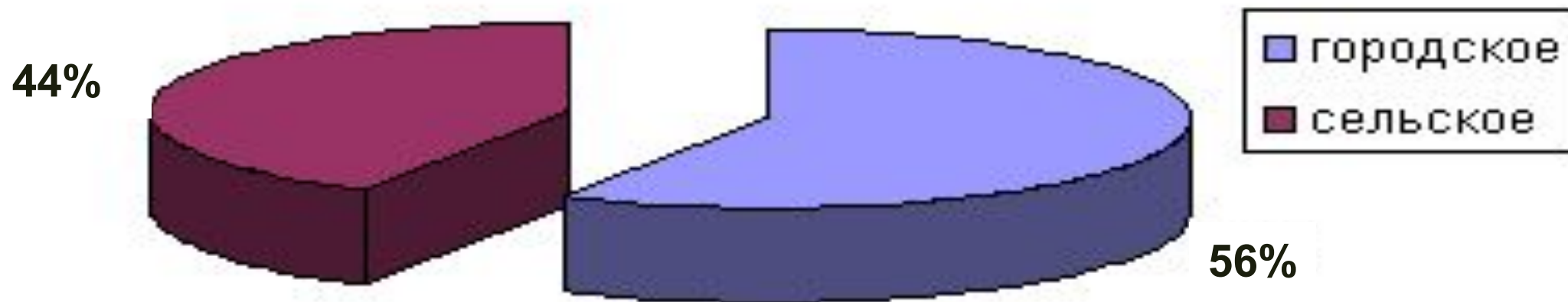
Соотношение городского и сельского населения на Северном Кавказе