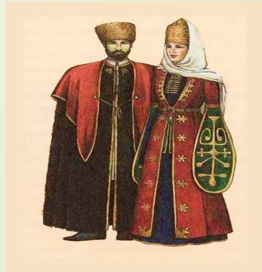
Народный костюм адыгов