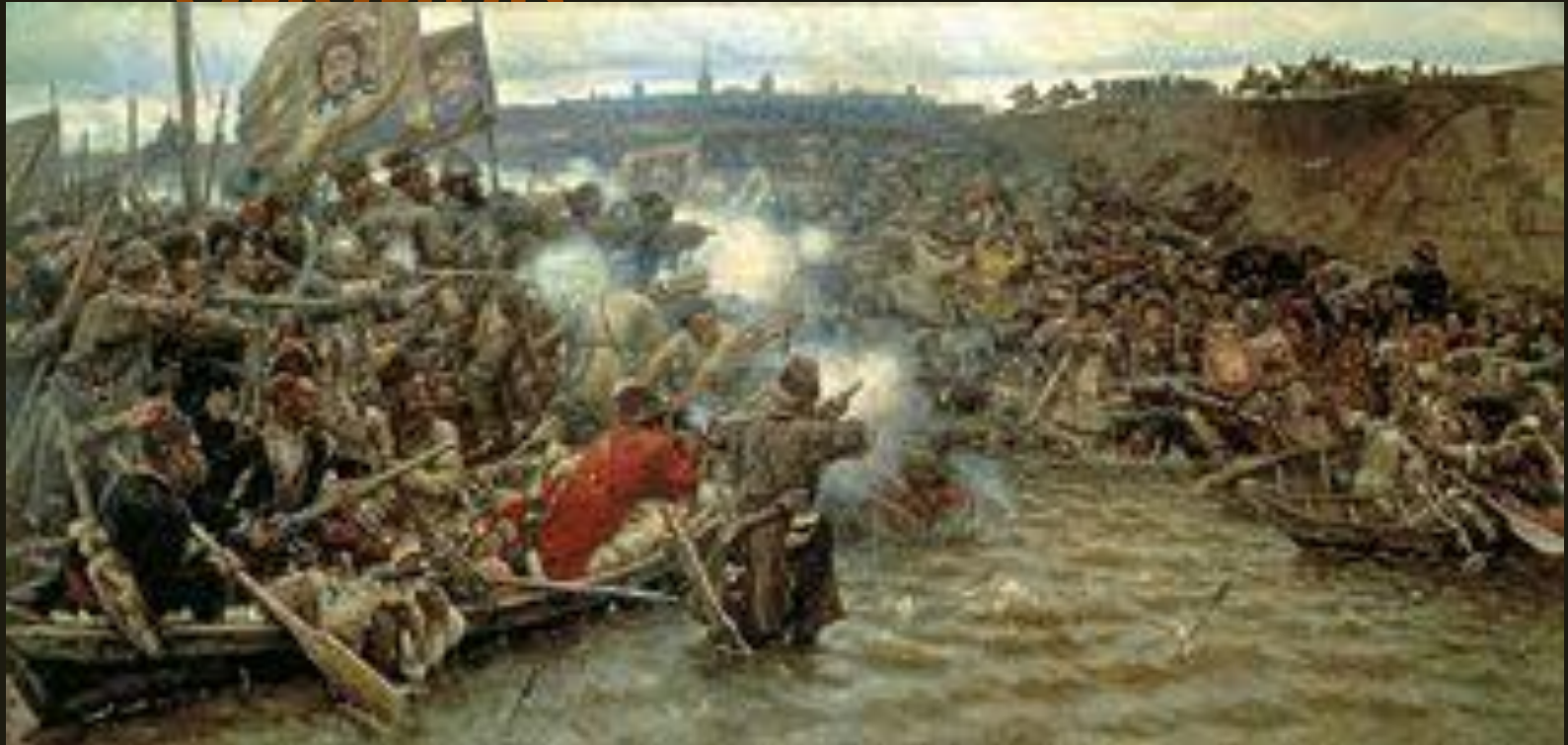
«Покорение Сибири Ермаком»