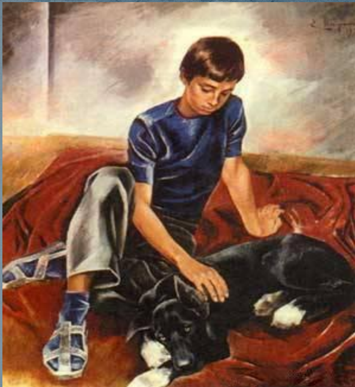
Е. Широков «Друзья»