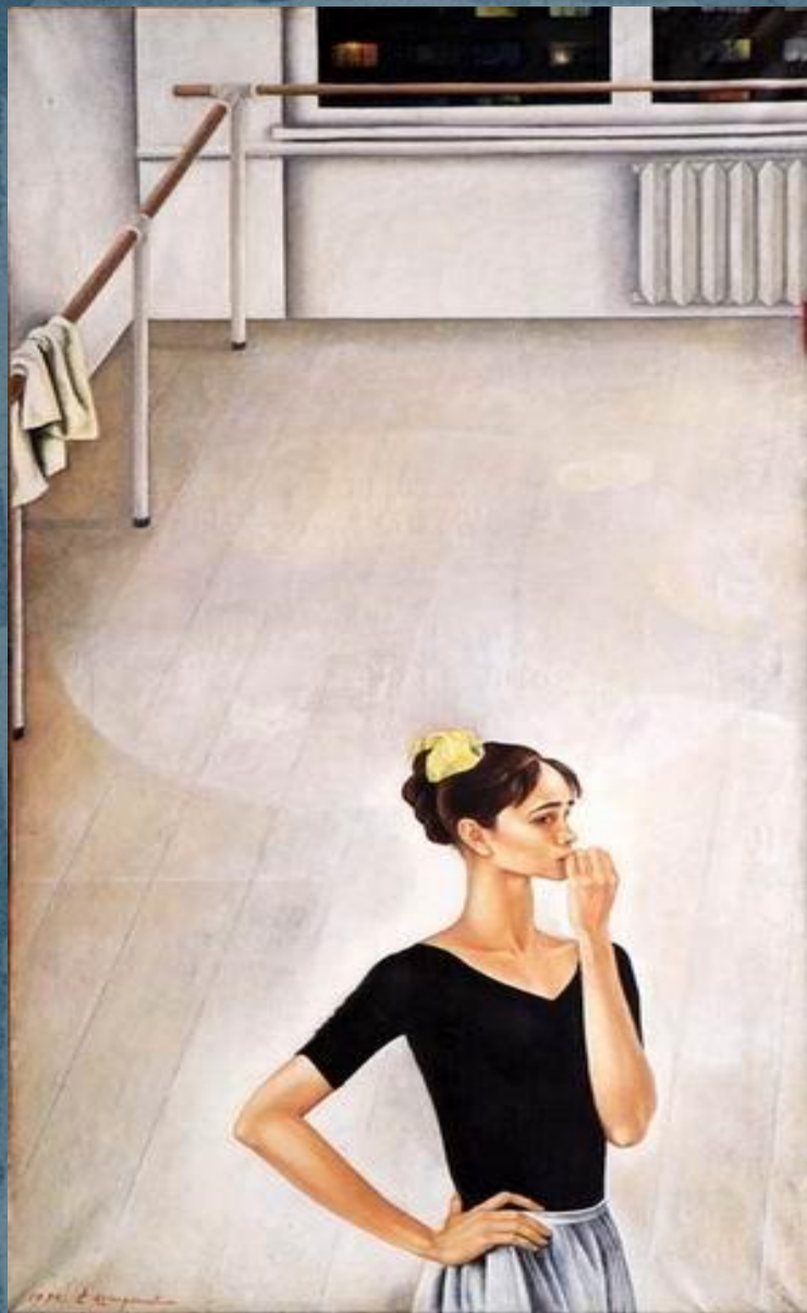
Портрет балерины Нади Павловой