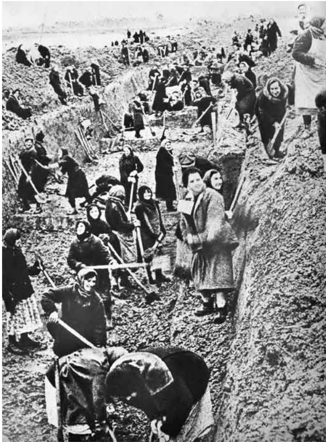
Москвичи на строительстве оборонительных сооружений.