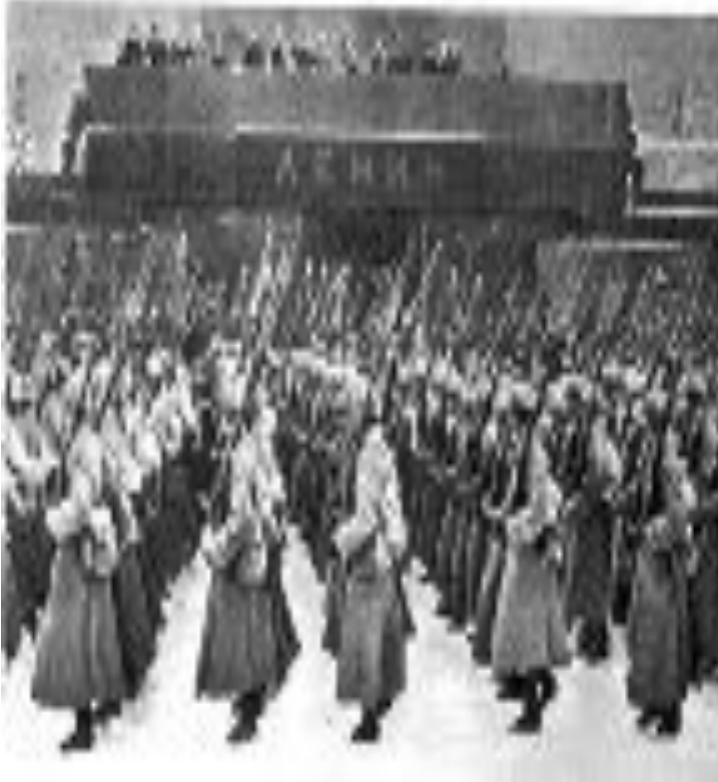
Парад на Красной площади. 7.11.1941