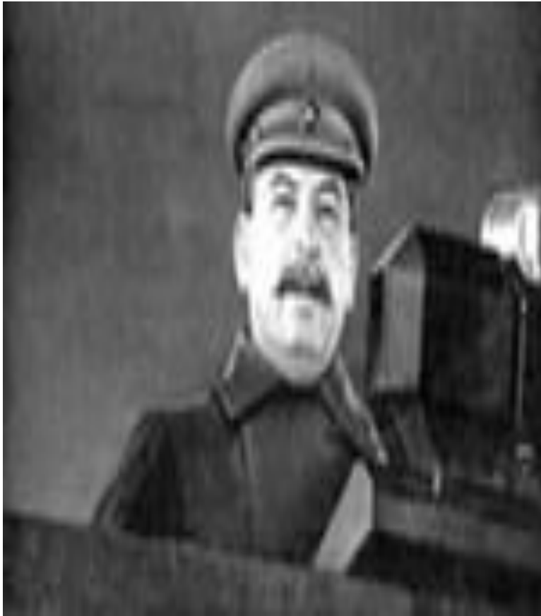
И.В. Сталин на трибуне Мавзолея. 7.11.1941