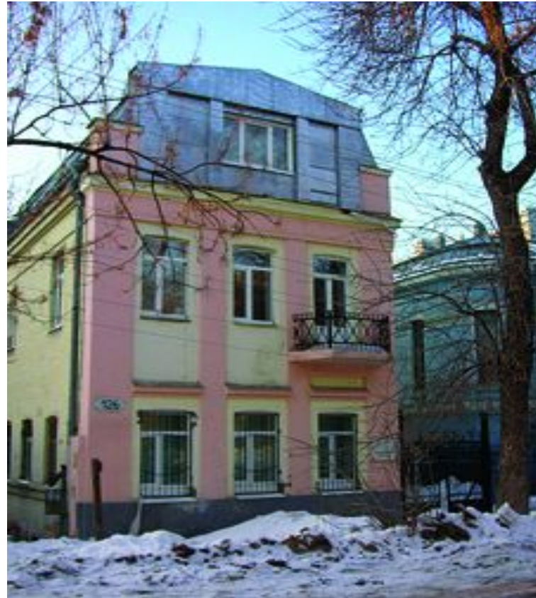
Посольство Греции Степана Разина, 126