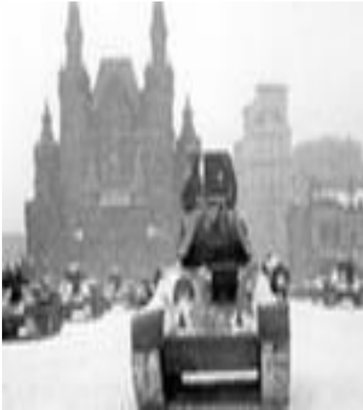
Парад на Красной площади. 7.11.1941