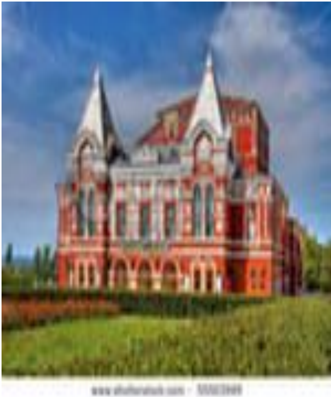
Театр драмы им. М. Горького