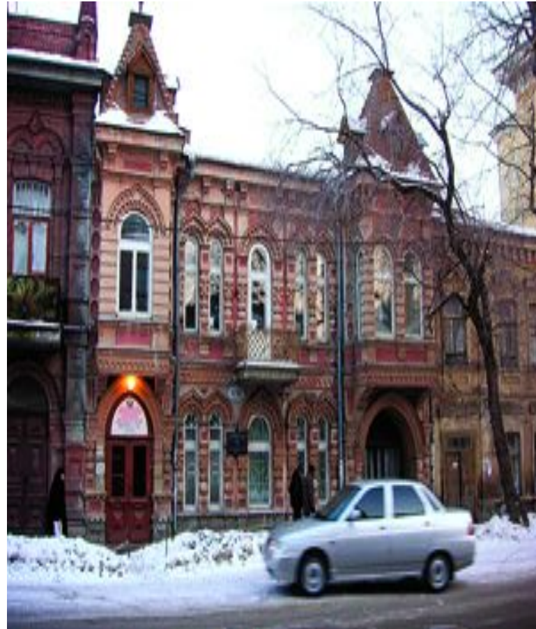
Посольство Норвегии Молодогвардейская, 119