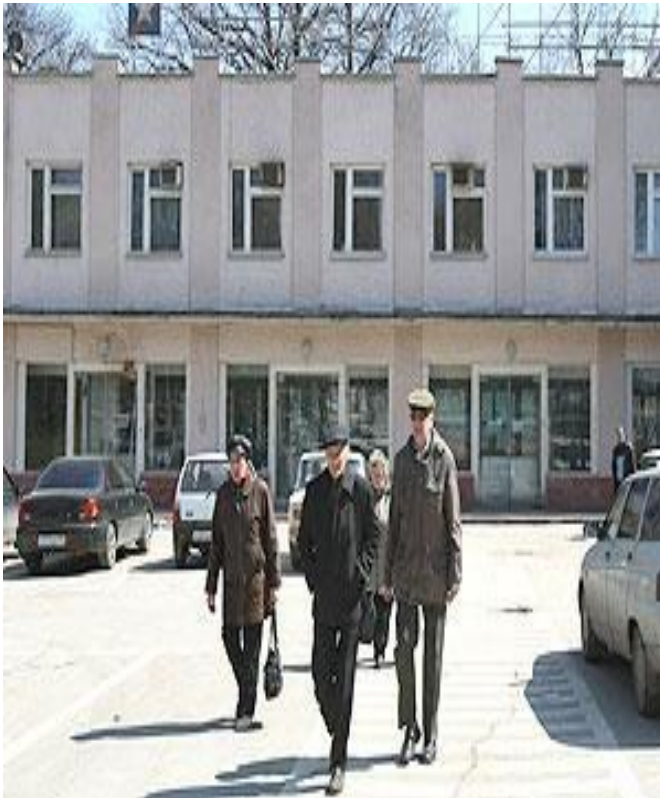
ОАО «Салют» (Куйбышевский механический завод)