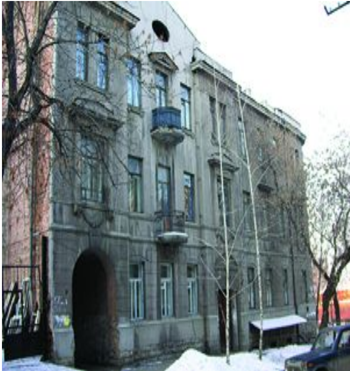
Посольство Китая Степана Разина, 108