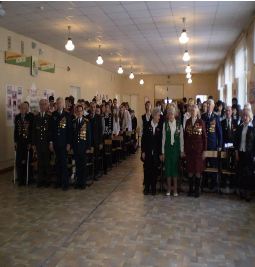
Ветераны в школе №129