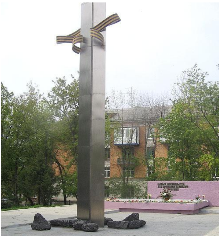
Стела и обелиск погибшим в годы Великой Отечественной войны