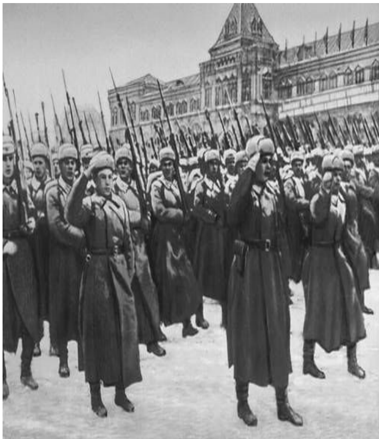
Парад на Красной площади. 7.11.1941