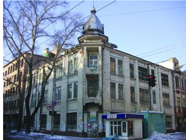
Посольство Болгарии Молодогвардейская, 126