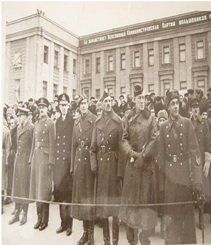
Иностранцы смотрели военный парад 7 ноября 1941 года из первых рядов.