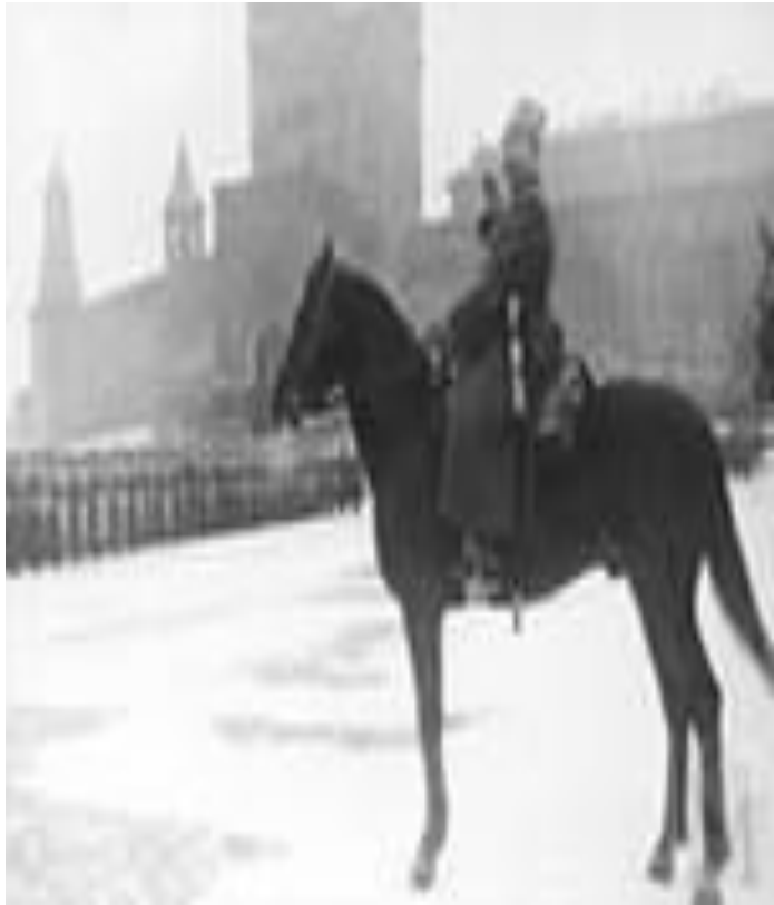
БУДЕННЫЙ Семен Михайлович