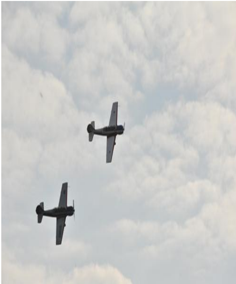
Фрагмент воздушного парада. Ноябрь, 1941