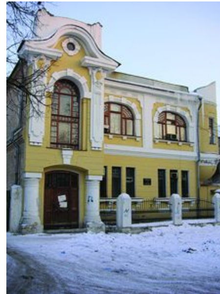
Посольство Польши Чапаевская, 165