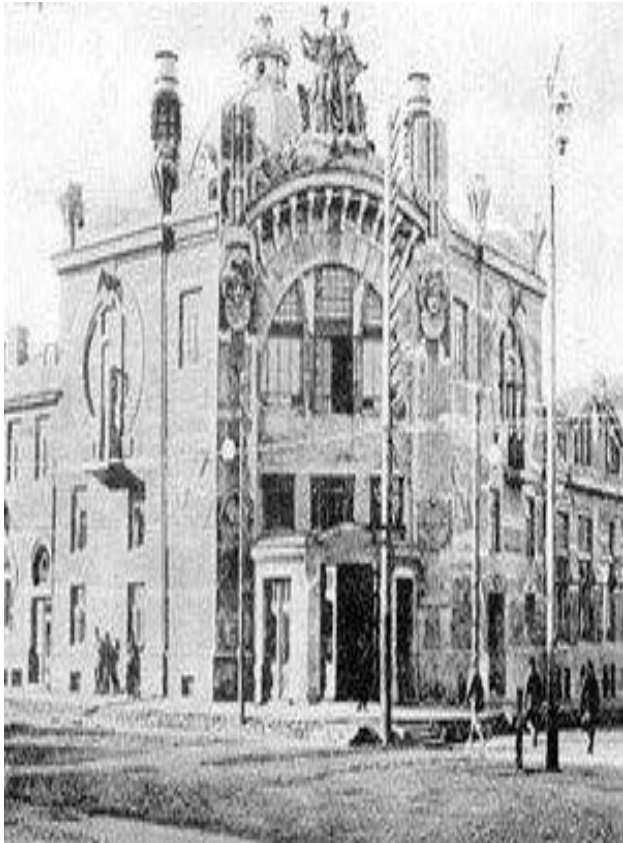
Театра-цирк «Олимп» (ныне филармония)