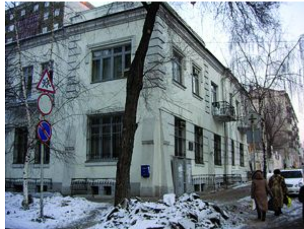
Посольство Канады Чапаевская, 181