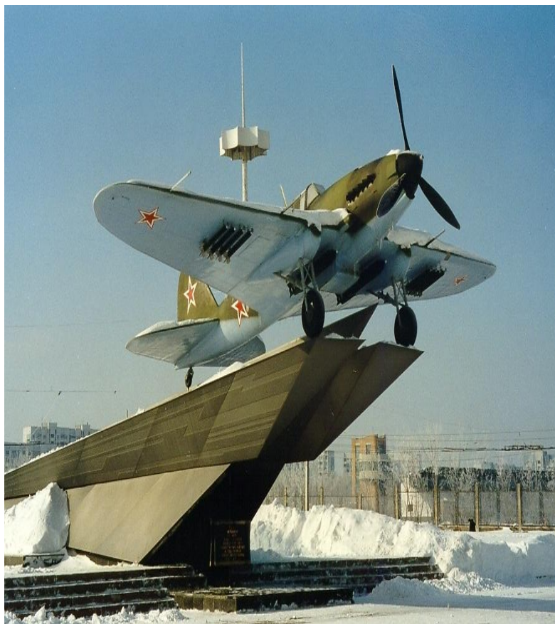
Памятник - боевой самолет Ил-2. (пересечение Московского шоссе и проспекта Кирова)