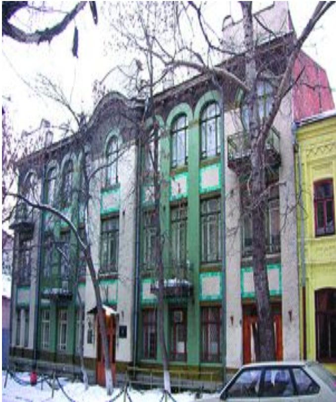
Посольство Японии Чапаевская, 82