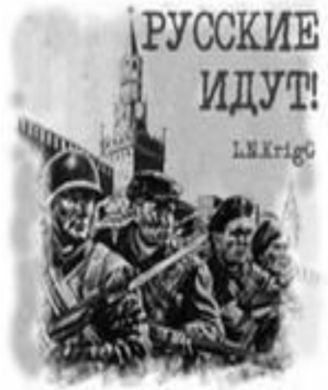
Оборона Москвы. 1941 г.