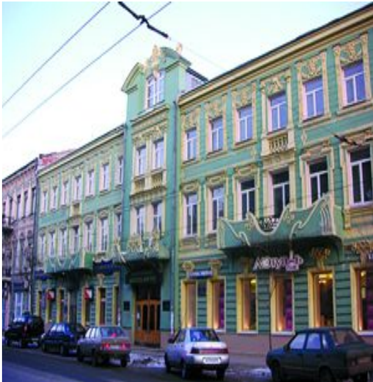
Представительство Комитета национального освобождения Франции Куйбышева, 111