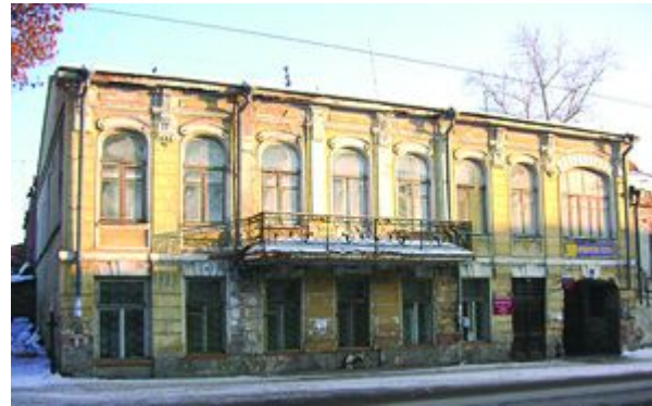
Посольство Турции Фрунзе, 57