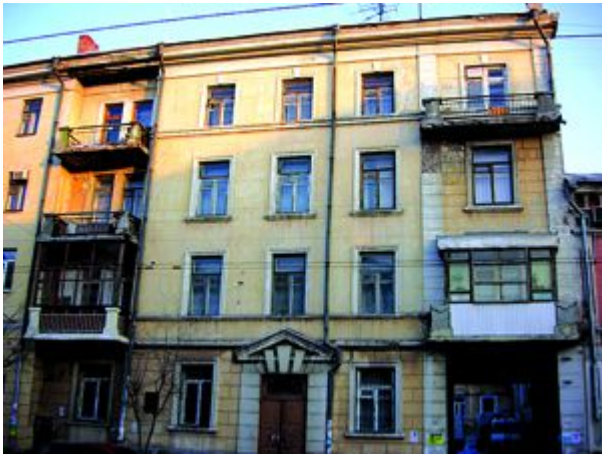
Посольство Кубы Куйбышева, 129