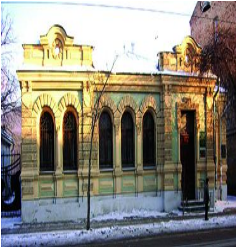
Посольство Чехословакии Фрунзе, 113