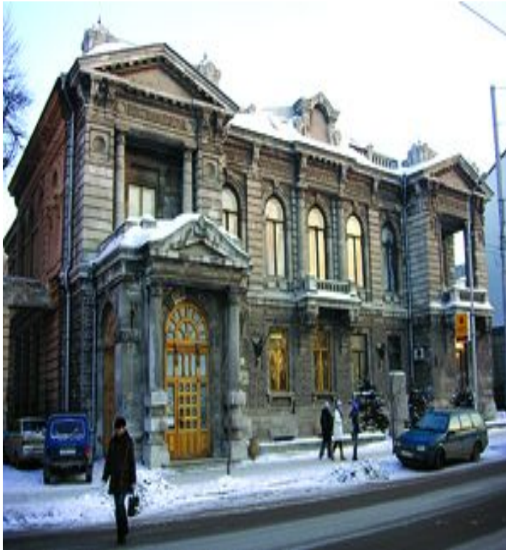
Посольство Великобритании Куйбышева, 151