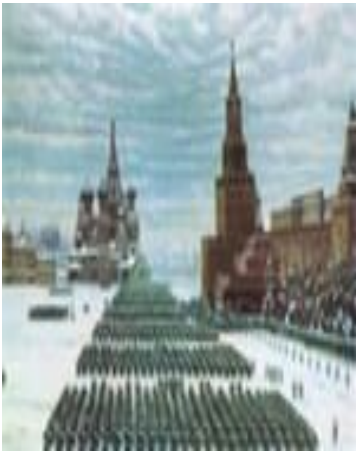
Красная площадь 7.11.1941