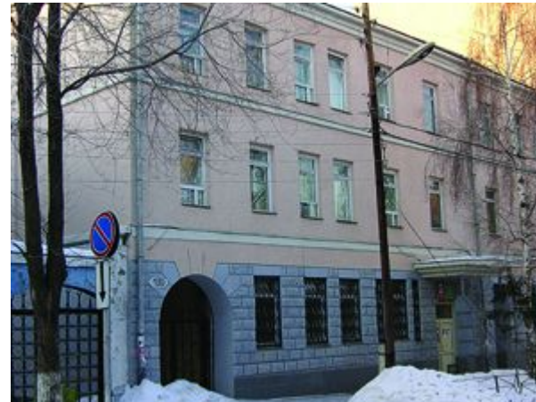
Посольство Ирана Степана Разина, 130