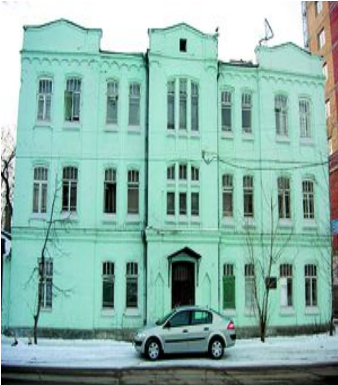
Посольство Бельгии Садовая, 166