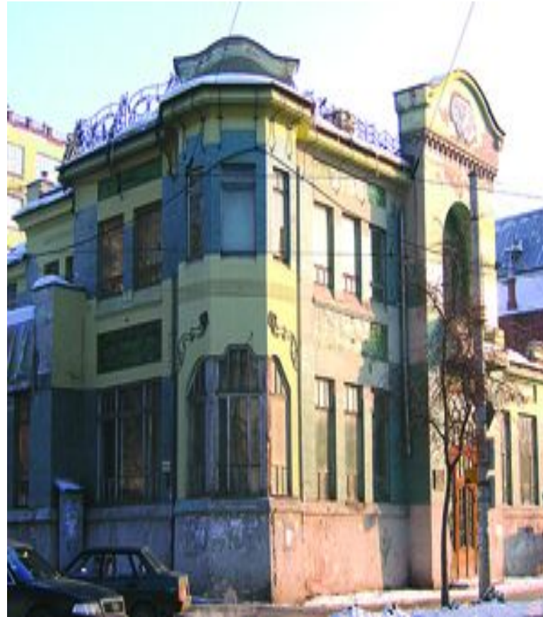
Посольство Швеции Фрунзе, 159