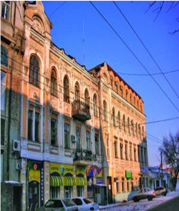
Посольство США Некрасовская, 62