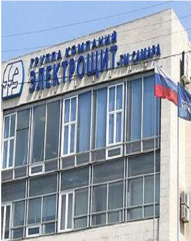
Завод «Электросит» (Красноглинский район)