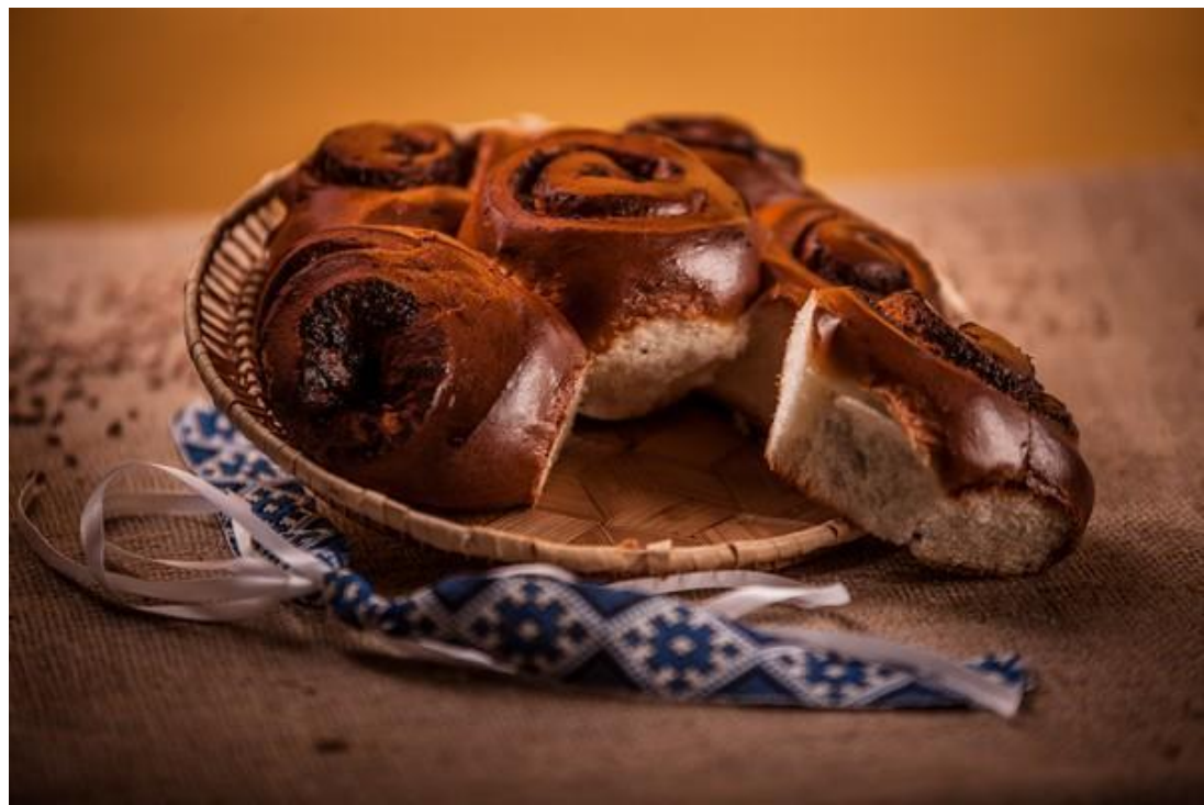
Витушка з маком