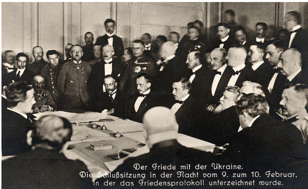
Підписання Брестського миру.

Через кілька тижнів в Україні не залишилося жодного червоноармійця. Німецькі й австро-угорські війська зайняли всю Україну. Німці розташувалися на півночі УНР, а австроугорці — на півдні. Центральна Рада та її уряд закликали український народ до спокою. Однак широкі верстви українства з недовір'ям зустріли нових окупантів.