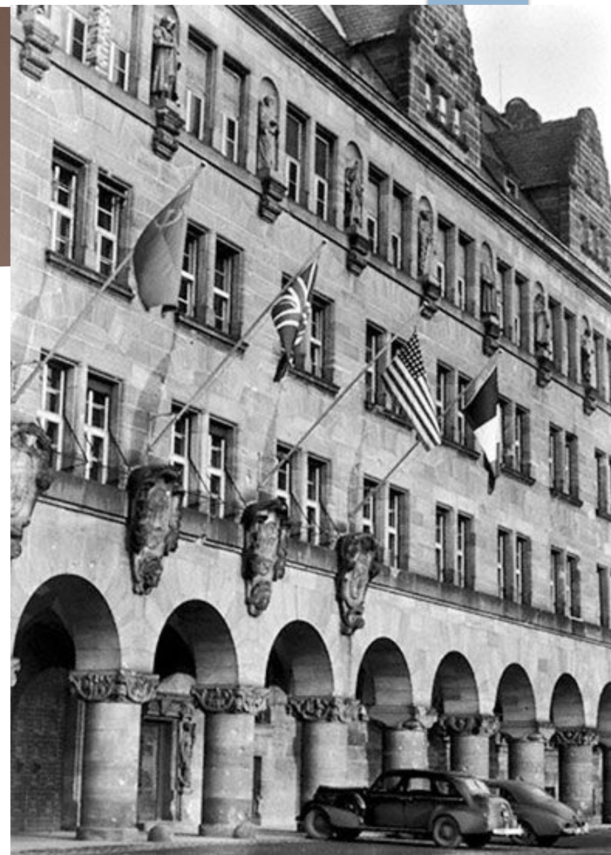
Здание Дворца юстиции в Нюрнберге, где проходил Нюрнбергский процесс

Первый судебный процесс над главными военными преступниками был проведён в Нюрнберге потому, что в течение многих лет этот город был цитаделью и символом фашизма. В нем проходили съезды национал-социалистской партии, проводились парады штурмовых отрядов. Международный военный трибунал в Нюрнберге - первый в истории международный суд . Нередко его называют "Судом истории".